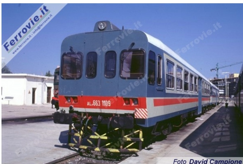
2, L'automotrice ALn 663.1109 caratterizzata dal rostro applicato in Sardegna, ripresa nella rimessa di Olbia. (Foto David Campione, 13 settembre 1999)

Consegnate contemporaneamente alle unità della serie 1000 sempre dalla FIAT, le 104 ALn 663.1100 si differenziano da queste unicamente per il diverso rapporto di trasmissione 2,39 che permette loro di sviluppare una velocità massima di 130 km/h. Caratteristiche tecniche e meccaniche accomunano per il resto le due serie, con l'unica variante che le 1100 possono essere accoppiate in comando multiplo fino ad un massimo di 3 unità tra loro o promiscuo esclusivamente con le ALn 668.3100.