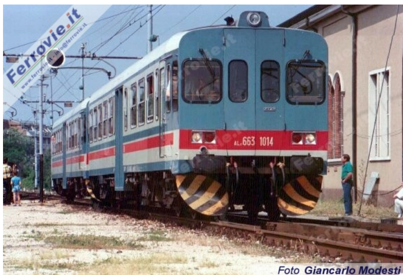
1, Automotrici ALn 663 1014 e 1013 con un treno speciale da Novara in arrivo a Luino nell'ambito della manifestazione "Locoemozioni". (Foto Giancarlo Modesti, 25 giugno 1989)

Consegnate dalla FIAT alle FS tra il 1983 ed il 1986 in 16 esemplari, le unità di questa serie sono caratterizzate da un rapporto di trasmissione 2,65 al ponte che le rende particolarmente adatte a linee di montagna con forte pendenza sulle quali possono sviluppare una velocità massima di 120 km/h. Con un'autonomia di oltre 1000 km ed una massa di 32 tonnellate, sono in grado di trasportare 12 persone in prima classe e 51 in seconda e possono essere accoppiate in comando multiplo fino ad un massimo di 3 unità tra loro o promiscuo esclusivamente con le ALn 668.3300.