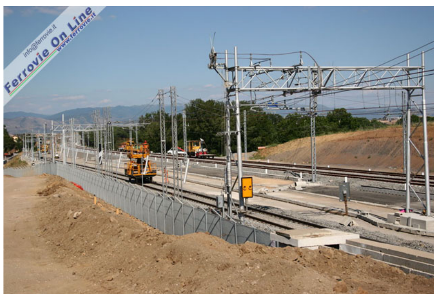
Scattata poche centinaia di metri più avanti della precedente, questa immagine mostra a sinistra il binario, attualmente unico, per la stazione di Salone e a destra il doppio binario per l'AV che piega verso il Posto Movimento di Salone. (Foto David Campione, 3 luglio 2005)