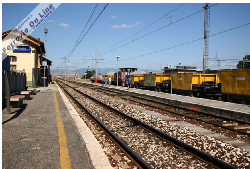
La stazione di Salone durante i lavori per l'attivazione del raddoppio, che lato Sulmona terminerà in questo impianto. (Foto David Campione, 3 luglio 2005)