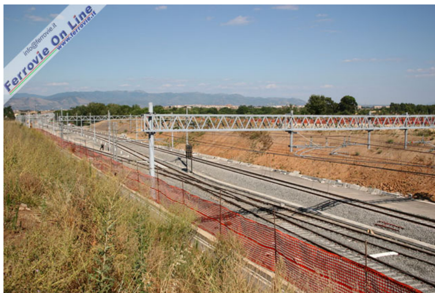
Tra La Rustica e Salone la linea AV si distacca dalla linea tradizionale. A destra nell'immagine i due binari per Napoli che confluiscono nel tracciato storico. (Foto David Campione, 3 luglio 2005)