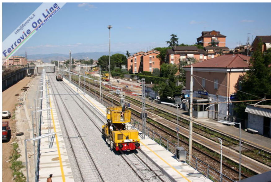
Si lavora per l'attivazione della nuova linea nella fermata imprenziata di Tor Sapienza, che ha sostituito la vecchia stazione dotata di binario di precedenza, visibile a destra. (Foto David Campione, 3 luglio 2005)

Le immagini che seguono documentano i lavori eseguiti sabato 2 e domenica 3 luglio per l'attivazione del nuovo tracciato e la dismissione del vecchio.