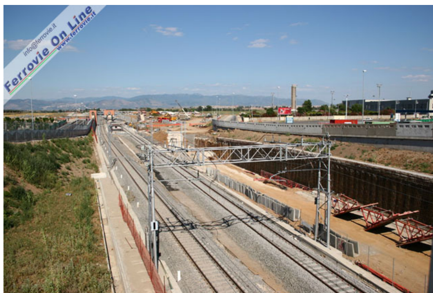
Il doppio binario nei pressi della nuova fermata La Rustica riconoscibile in lontananza e caratterizzata da marciapiede intermedio. Sulla destra il sedime per i due binari dell'AV per Napoli. (Foto David Campione, 3 luglio 2005)