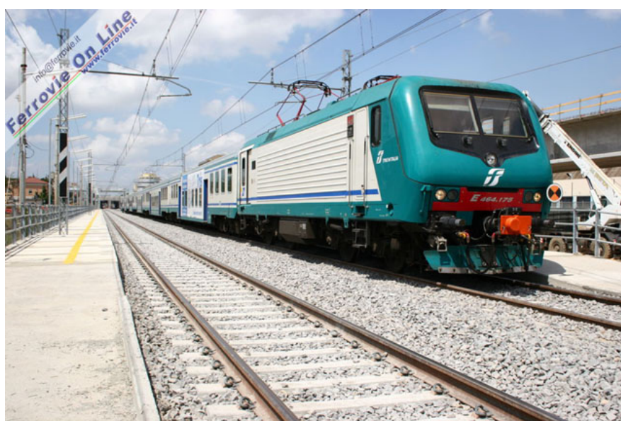
Il Regionale 7512 per Tivoli in sosta per servizio viaggiatori nella nuova fermata di Tor Sapienza, qualche giorno dopo l'attivazione del nuovo tracciato. (Foto David Campione, 9 luglio 2005)