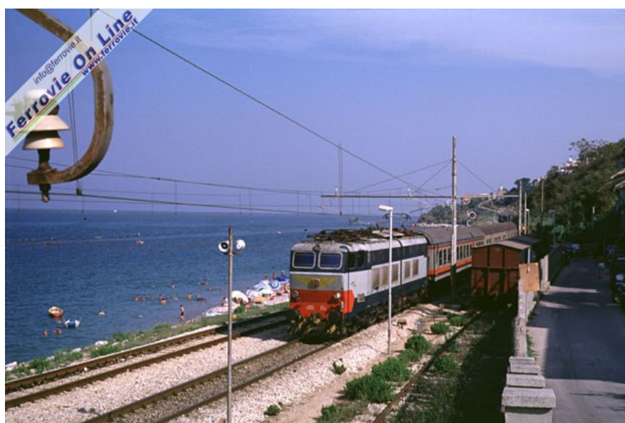
La E.656.282 fa il suo ingresso nella stazione di San Vito-Lanciano, con il treno Regionale 3188 proveniente da Termoli. (Foto David Campione, 15 agosto 1998)