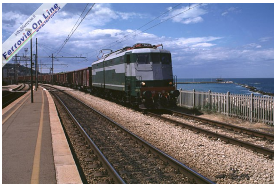
Il Mercì 56287 Ancona - Foggia con la E.645.101 in livrea storica, ricevuto sul terzo binario di San Vito per effettuare incrocio con un treno viaggiatori diretto verso nord. (Foto David Campione, 16 luglio 2002)