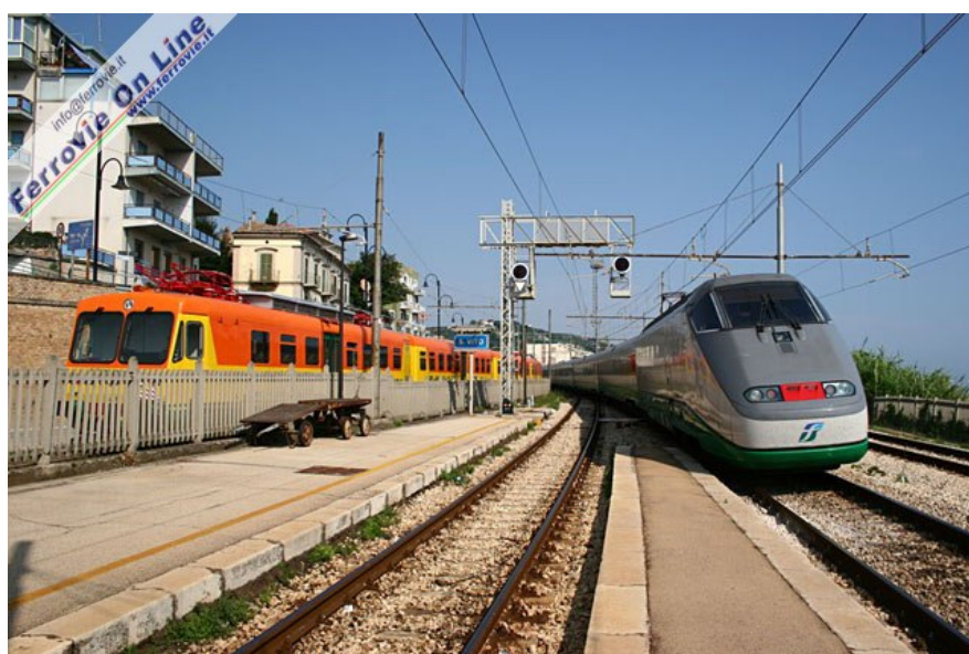
L'Eurostar 9410 da Taranto transita sul binario 2, di corretto tracciato, diretto verso Milano. Alla sinistra della staccionata un treno della Ferrovia Sangritana è in sosta nella stazione FAS di San Vito Marina. (Foto David Campione, 26 giugno 2005)