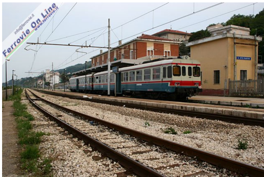
Vista d'insieme per la piccola stazione di San Vito Lanciano. In sosta sul primo binario una coppia di automotrici ALn 776 della Sangritana, in attesa di partire per Lanciano. (25 giugno 2005)