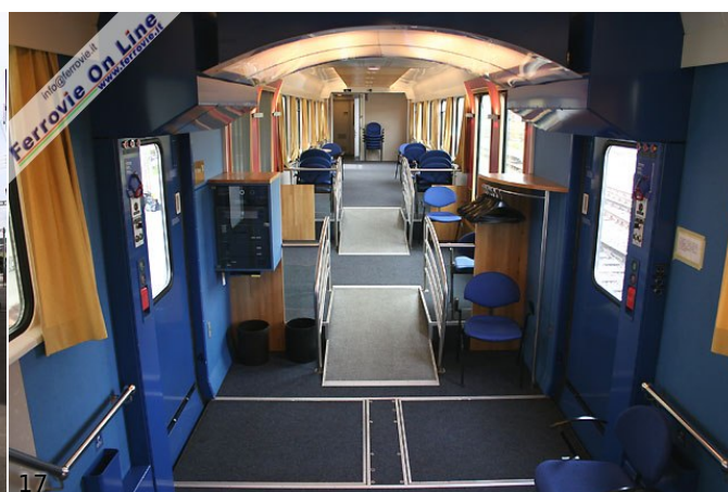
16. La carrozza "Le Salon Forum". (Foto David Campione, 13 maggio 2006)