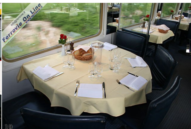
18. Carrozza ristorante delle Ferrovie Svizzere. Può essere messa in composizione a treni ordinari o riservati, meglio se abbinata alle carrozze "Le Salon De Luxe" e "Le Salon Forum". 19. Interno della carrozza ristorante, con il tipico tavolo circolare da cinque posti. La vettura dispone di cucina propria e angolo bar.

Esempi di prezzo per il noleggio di treni/carrozze speciali