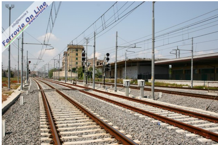
6. Stazione di Roma Prenestina: in primo piano il doppio binario che sarà a servizio solo della linea alta velocità. Qui la posa dell'armamento e del pietrisco è stata ultimata, così come la linea aerea. Seppur non ancora in esercizio, in questo tratto i segnali sono già accesi. (Foto David Campione, 7 maggio 2006)