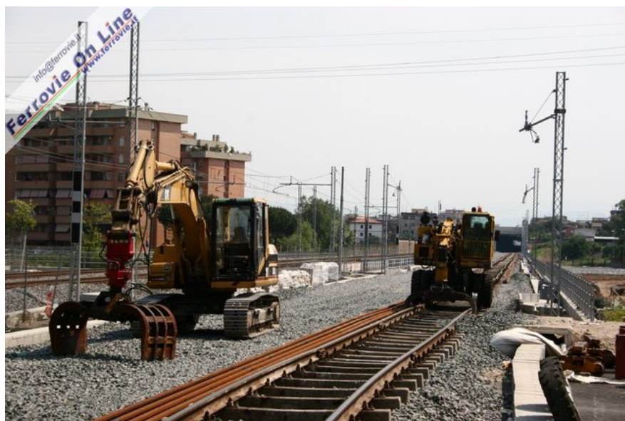
3. Mezzi d'opera sulla sede ferroviaria, inquadrata in direzione de La Rustica. (Foto David Campione, 7 maggio 2006)