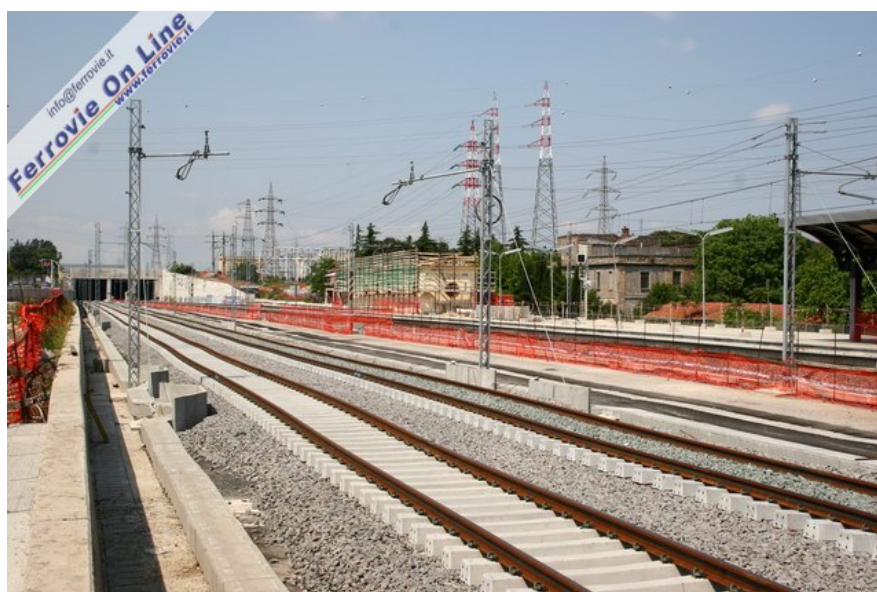
5. In zona Collatina, alla data della foto la posa dei binari è stata ultimata, mentre si sta procedendo con la messa in opera della palificazione della linea aerea. (7 maggio 2006)