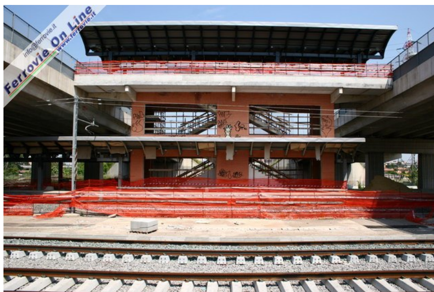
4. A pochi chilometri da Tor Sapienza, procedendo verso il centro città si incontra la nuova fermata Palmiro Togliatti, ancora in completamento. Il fabbricato viaggiatori sorge tra i due ponti stradali dell'omonima via romana, che in questo punto scavalcano la sede ferroviaria. In primo piano il doppio binario della linea per Napoli. (Foto David Campione, 7 maggio 2006)