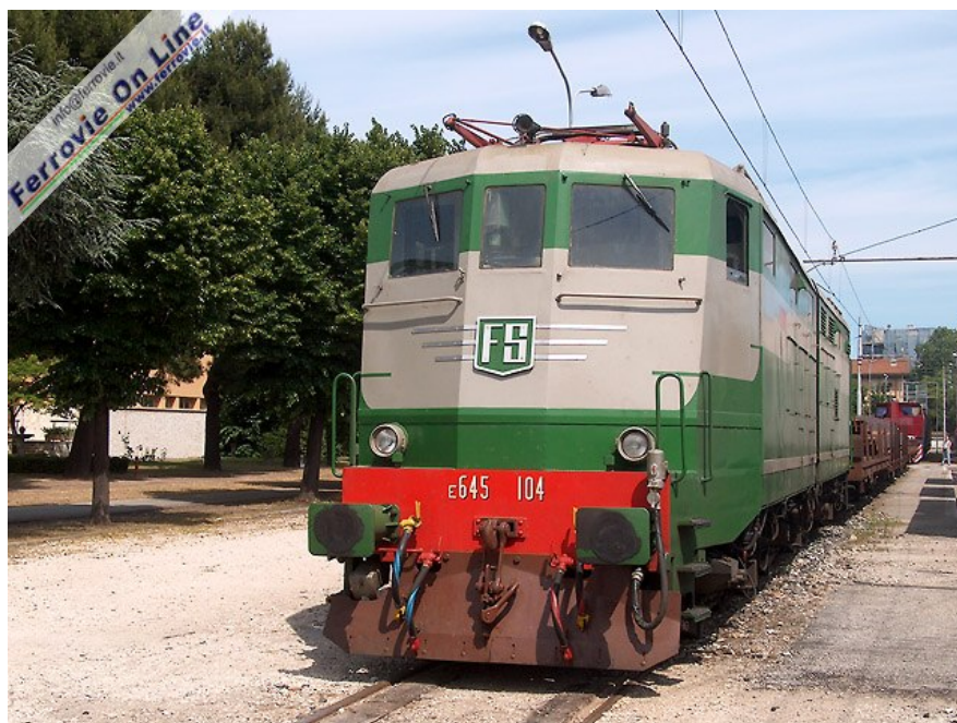
7. Anche l'E.645.104, pure in livrea storica, era fra i mezzi tuttora in servizio regolare esposti al pubblico a "Il Treno del Tempo". (4 giugno 2006)

Unica nota davvero stonata, certamente non per demerito di Adriavapore, la mancanza di una locomotiva a vapore in pressione, che avrebbe dovuto essere la 640.121, prevista nel programma e sicuramente al centro delle aspettative di molti, ma impedita all'ultimo momento da un contrattempo di ordine burocratico.