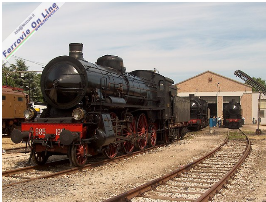
1. La 685.196, equipaggiata con splendidi fanaloni a petrolio, fa bella mostra di sé sul piazzale del Deposito Rotabili Storici di Rimini, insieme alle altre macchine della flotta storica in carico ad "Adriavapore". (Foto Jacopo Fioravanti, 4 giugno 2006)

"Il Treno del Tempo", l'esposizione di mezzi di trazione antichi e moderni organizzata ormai annualmente dall'associazione A.T.S.E.R. "Adriavapore" presso la propria sede nell'ex-Deposito Locomotive di Rimini, ha riscosso anche quest'anno un meritato successo di pubblico, composto, come sempre, non solo da appassionati.