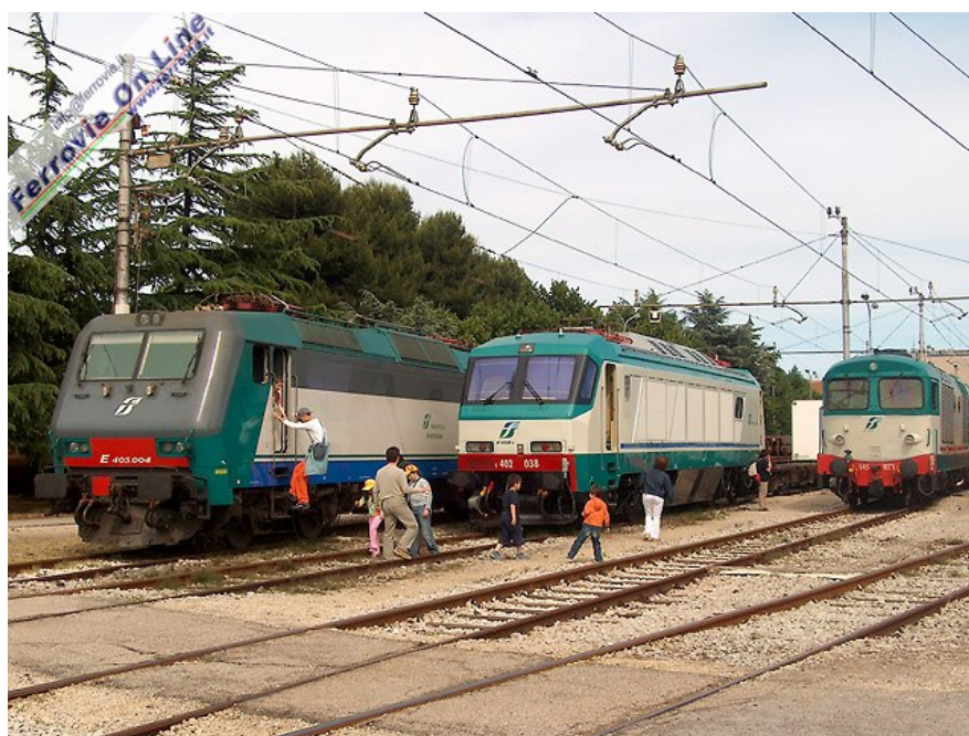
8. Parata di locomotive moderne, esposte a Rimini fianco a fianco con le locomotive storiche: da sinistra a destra, E.405.004 (protagonista delle corse per il pubblico insieme ad altre macchine), E.402.038, D.445.1023 e 1033 (in seconda posizione). (Foto Jacopo Fioravanti, 4 giugno 2006)

Unica nota davvero stonata, certamente non per demerito di Adriavapore, la mancanza di una locomotiva a vapore in pressione, che avrebbe dovuto essere la 640.121, prevista nel programma e sicuramente al centro delle aspettative di molti, ma impedita all'ultimo momento da un contrattempo di ordine burocratico.