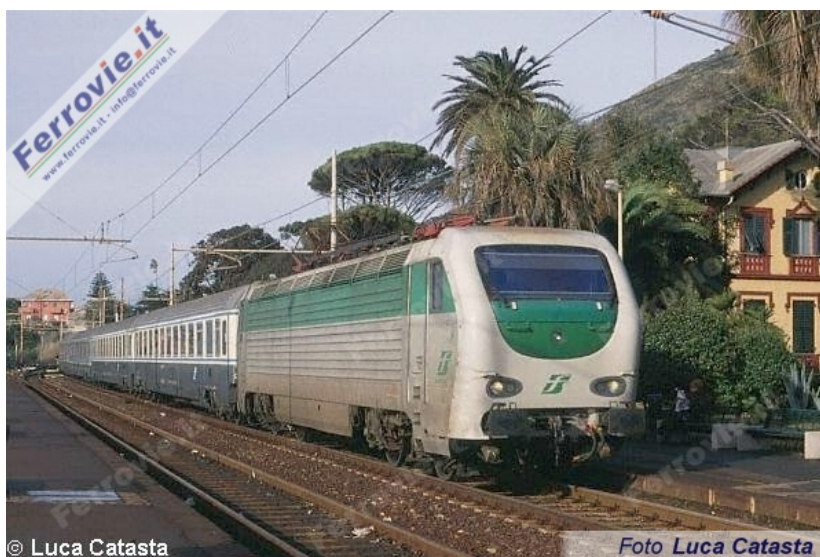
4, Stranamente priva del vomere frontale, la E.402.110 transita nella stazione di Genova Nervi, in testa ad un treno Intercity per Roma. (Foto Luca Catasta, 27 dicembre 1999)

Dopo aver fatto alcuni scatti mi potevo considerare più che soddisfatto della mia "caccia alle 321", anche se ancora non l'avevo vista muoversi; decisi così di andare a fare qualche foto a Genova Nervi, per ritrarre le moderne E.402B in testa agli IC da e per Roma. Poco dopo il mio arrivo, in una particolare atmosfera che avvolgeva la stazione, dovuta all'imponente mareggiata che arrivava a bagnare addirittura i binari, transitava la E.402.110, stranamente priva del vomere con la marcatura, probabilmente per un urto.