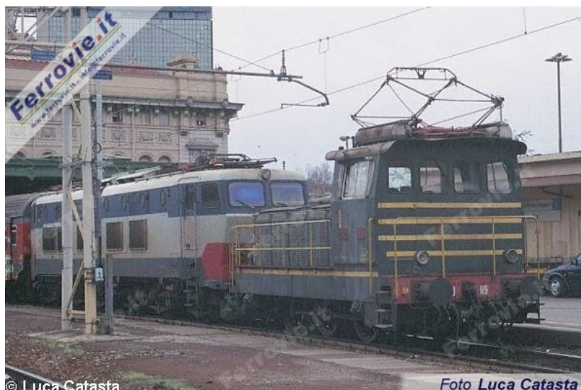
5. La E.321.119 impegnata nella manovra di un convoglio di vetture MDVE con una E.656 inattiva, in stazione a Genova Brignole. (Foto Luca Catasta, 27 dicembre 1999)

Nonostante ciò, decido di trasferirmi ad Arquata Scrivia e di continuare il viaggio di ritorno a bordo di una delle ultime ALe 540 in servizio, che nei giorni feriali collega questa stazione con Tortona e Voghera. Come se non bastasse mi è capitata anche l'unica del gruppo della terza serie assegnata ad Alessandria, ovvero la 028, ancora ben tenuta ed arzilla nel servizio. Per concludere al meglio la splendida giornata, a Tortona ho avuto modo di fotografare la ALe 540 su cui avevo viaggiato a fianco della ALe 540.002 e della E.633.092, fresca di revisione e nella livrea XMPR del secondo tipo.