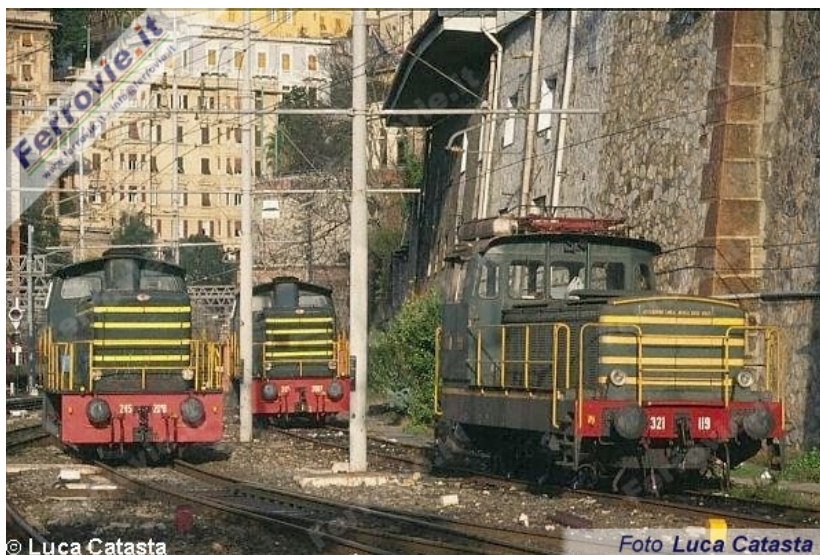
3, La E.321.119 in sosta su un tronchino della stazione di Genova Brignole, mentre una 245 è impegnata in manovra. (Foto Luca Catasta, 27 dicembre 1999)

Subito le mie attenzioni si sono ovviamente rivolte all'anziana locomotiva che faceva ancora bella mostra di sé a fianco delle diffusissime diesel 245.