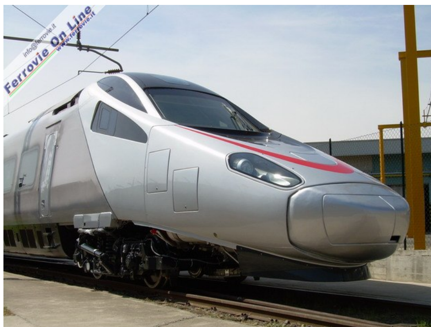
L'avveniristico muso del Pendolino, che diventerà una presenza abituale sui binari di Italia e Svizzera già dai primi mesi del 2007. (Foto Maurizio Tolini, 5 giugno 2006)