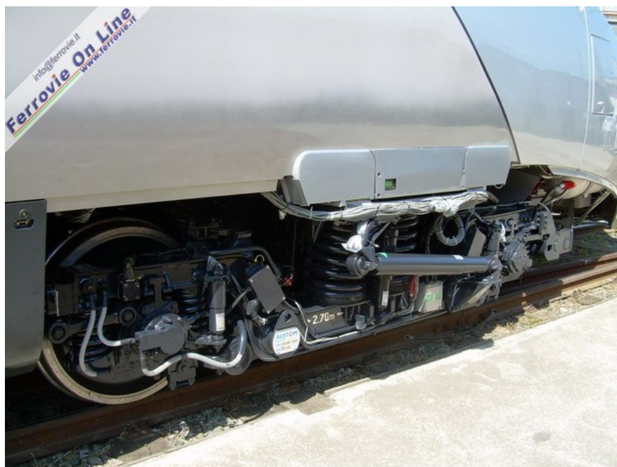
I carrelli del nuovo Pendolino riprendono in linea di massima il modello già in opera su altri elettrotreni della stessa famiglia. (Foto Maurizio Tolini, 5 giugno 2006)