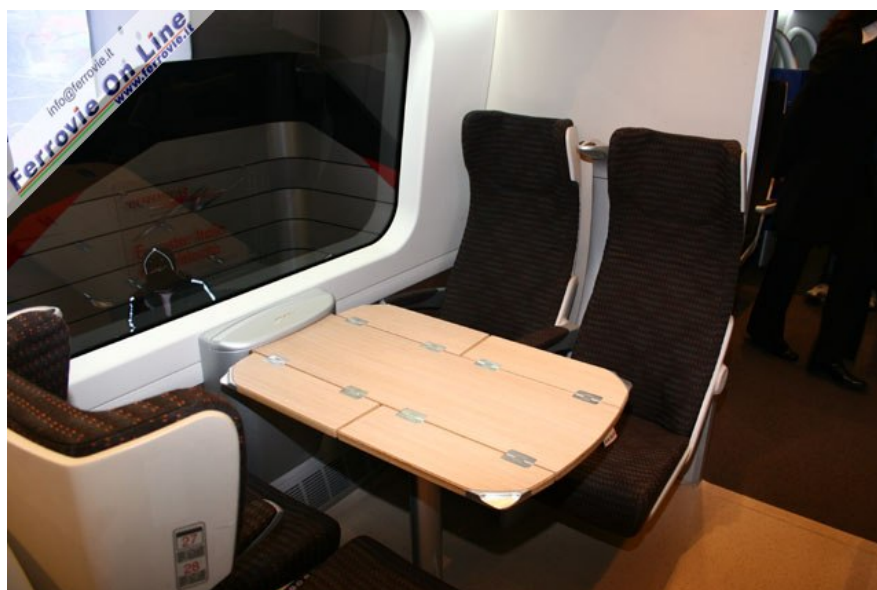
Gli interni del nuovo Pendolino, allestiti su un'apposita maquette dello stesso treno in scala 1:1. (Foto David Campione, 6 novembre 2005)