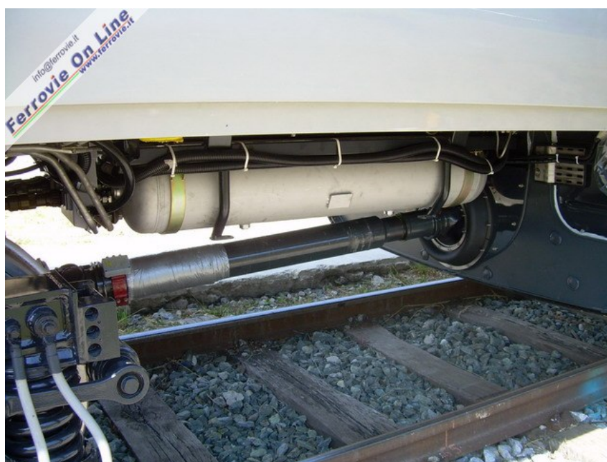
L'albero di trasmissione del nuovo Pendolino: a destra il sottocassa che ospita il motore ed a sinistra il carrello anteriore dell'elettotreno. (Foto Maurizio Tolini, 5 giugno 2006)