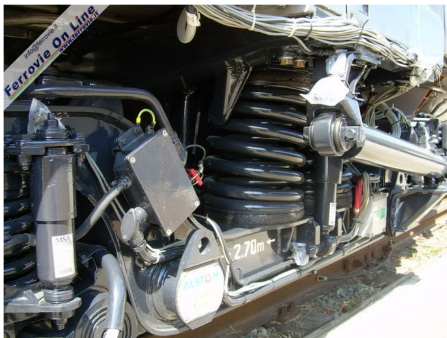
Particolare del carrello: ben in evidenza la sospensione secondaria e lo smorzatore antiserpeggio.