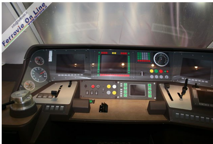
Nel simulacro è stato riprodotto anche la luminosa cabina di guida, con il banco di manovra, qui in esposizione a Milano. (Foto David Campione, 6 novembre 2005)