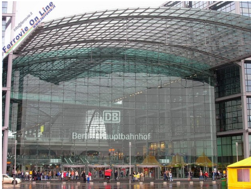
1. La nuova Hbf della capitale tedesca si presenta con due ingressi paralleli, ecco quello principale (accesso/deflusso pedonale, taxi o bus) in un immagine della luminosa facciata.

Proprio la nuova Berlin Hauptbahnhof ed i suoi dintorni sono l'oggetto della seguente sequenza fotografica effettuata sfruttando quei pochi momenti favorevoli che le condizioni climatiche del periodo hanno concesso.