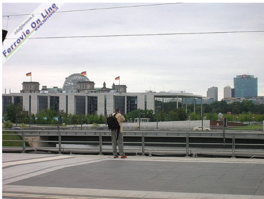
12. Anche i marciapiedi, nei tratti di estremità non coperti dalla cupola di cristallo, offrono innumerevoli spunti fotografici: non a caso anche qui è tutto un brulicare di telecamere e macchine fotografiche, persino i passeggeri in procinto di partire ingannano l'attesa scattando o filmando... Nell'immagine si riconoscono nuovamente il Parlamento, vari edifici governativi e, sulla destra, la Bahn-Tower ossia la sede centrale DB, al numero 2 di Potsdamer Platz, la piazza più importante di Berlino ricostruita dopo la riunificazione secondo il progetto di Renzo Piano. (Foto Andrea Roveta, settembre 2006)