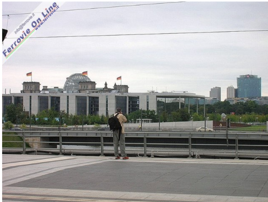
12. Anche i marciapiedi, nei tratti di estremità non coperti dalla cupola di cristallo, offrono innumerevoli spunti fotografici: non a caso anche qui è tutto un brulicare di telecamere e macchine fotografiche, persino i passeggeri in procinto di partire ingannano l'attesa scattando o filmando... Nell'immagine si riconoscono nuovamente il Parlamento, vari edifici governativi e, sulla destra, la Bahn-Tower ossia la sede centrale DB, al numero 2 di Potsdamer Platz, la piazza più importante di Berlino ricostruita dopo la riunificazione secondo il progetto di Renzo Piano. (Foto Andrea Roveta, settembre 2006)