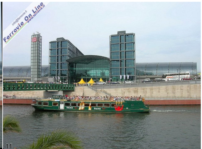
10. L'andirivieni di barconi davanti alla stazione è davvero vivace... (Foto Andrea Roveta, settembre 2006)