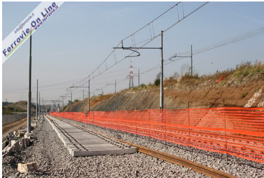
Il 22 ottobre tra Salone e Lunghezza è stato attivato un flessò provvisorio tra le progressive 13+753 e 11+328, che in parte costituirà il futuro binario pari del costruendo raddoppio. Nell'immagine la nuova sede ferroviaria con il binario dispari già posato, mentre è in corso la posa del pari. Alle spalle in alto la linea storica a semplice binario non più in servizio. (Foto David Campione, 29 ottobre 2006)