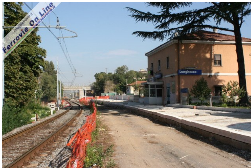
Per consentire i lavori di raddoppio, nella stazione di Lunghezza è stato rimosso il binario di precedenza, spostato di alcune centinaia di metri lato Tivoli. (Foto David Campione, 29 ottobre 2006)