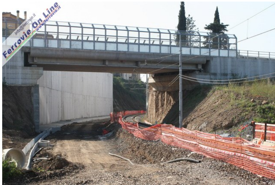
Il raddoppio del tracciato tra Salone e Lunghezza ha implicato diverse modifiche alla viabilità locale, come la soppressione del passaggio a livello sulla via Collatina, sostituito da circa un anno da un sottovia. In ambito della stazione di Lunghezza, è stato demolito il vecchio e stretto ponte stradale lato Roma, ricostruito con luce opportunamente dimensionata come si può vedere in foto. (29 ottobre 2006)