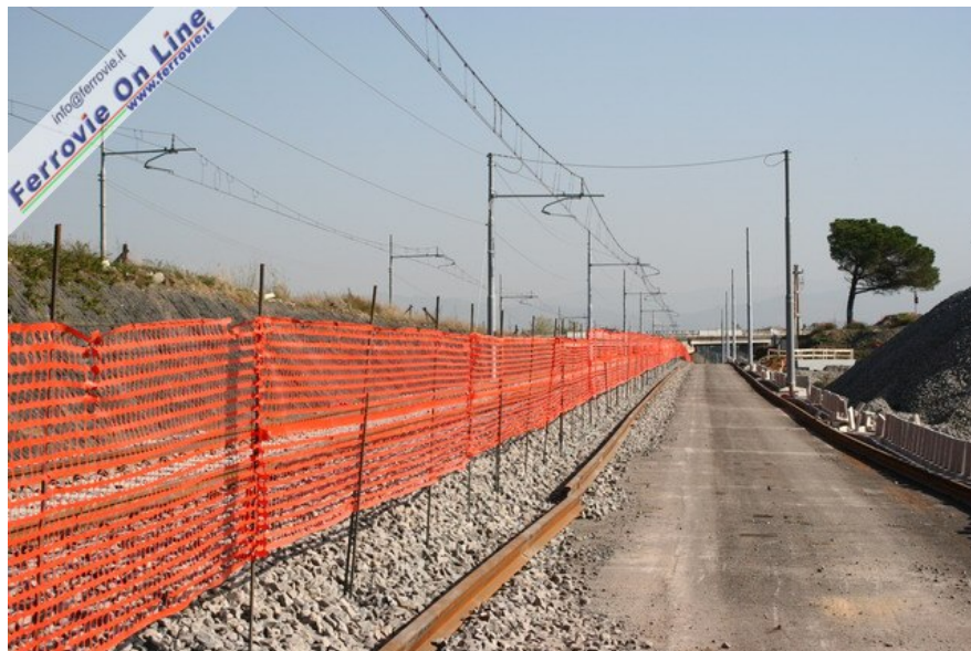
Alla data della foto il sedime era pronto per la posa del binario pari. (Foto David Campione, 29 ottobre 2006)