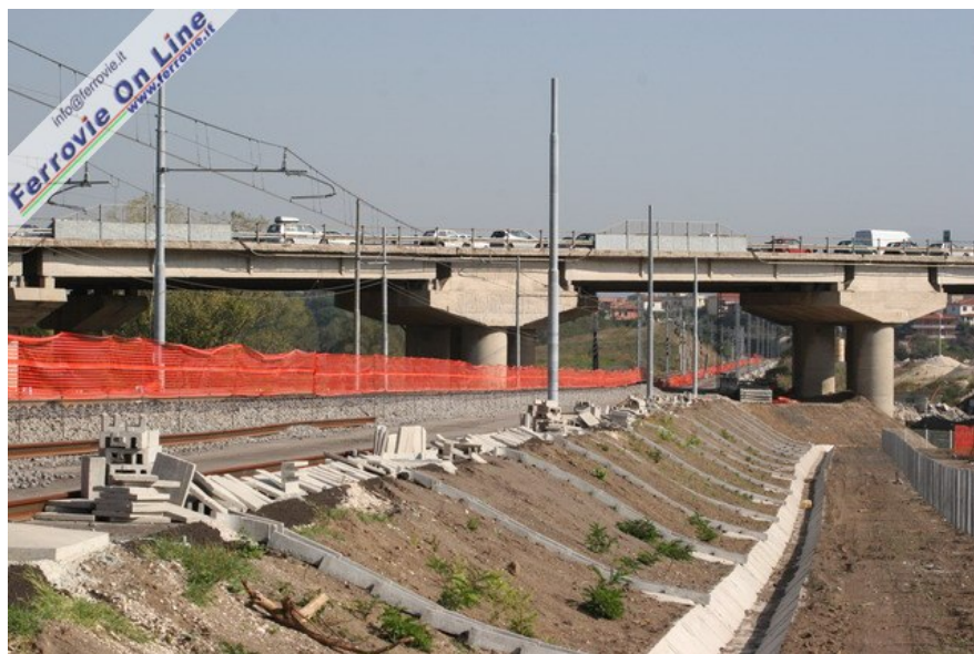
Nei pressi di Lunghezza la ferrovia sottopassa l'Autostrada dei Parchi A24, sfruttando una nuova luce del viadotto, anziché la precedente, immediatamente riconoscibile a sinistra grazie alle protezioni poste a lato della corsia di marcia. (Foto David Campione, 29 ottobre 2006)