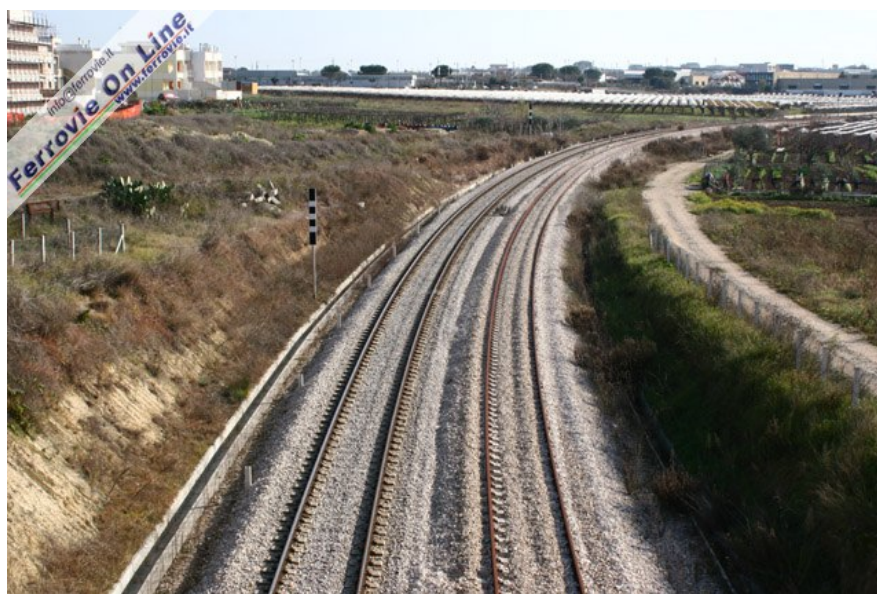
Partiranno a gennaio i lavori per rendere operativo il raddoppio Noicattaro - Rutigliano, con la messa in opera dei segnali e degli impianti ACEI necessari per la circolazione. Nell'immagine l'ampio curvone in uscita da Noicattaro, con a sinistra il binario già in esercizio. Qui termina la breve variante di tracciato: a sinistra si riconosce il sedime su cui correva il semplice binario a servizio della vecchia stazione. (27 dicembre 2006)