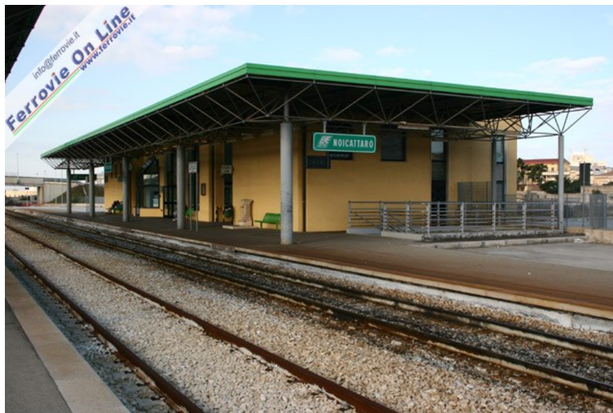
Così si presenta il nuovo fabbricato viaggiatori di Noicattaro, dotato di tre binari per servizio passeggeri. (27 dicembre 2006)