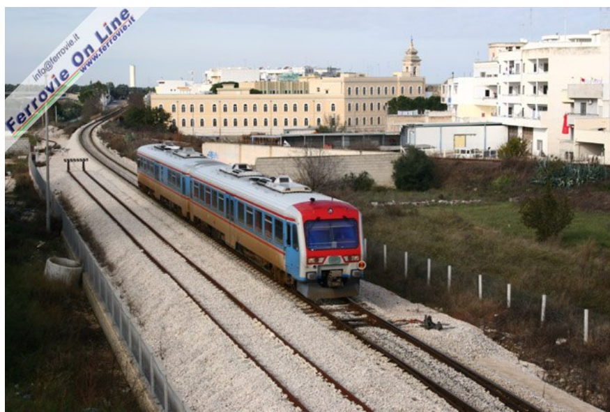
Una coppia di moderne automotrici FIAT impegna il nuovo tracciato alle porte di Noicattaro, proveniente da Bari. Qui termina il raddoppio del binario realizzato in sede nuova, mentre sullo sfondo a destra si riconosce il vecchio tracciato ferroviario oggi abbandonato. (Foto David Campione, 27 dicembre 2006)