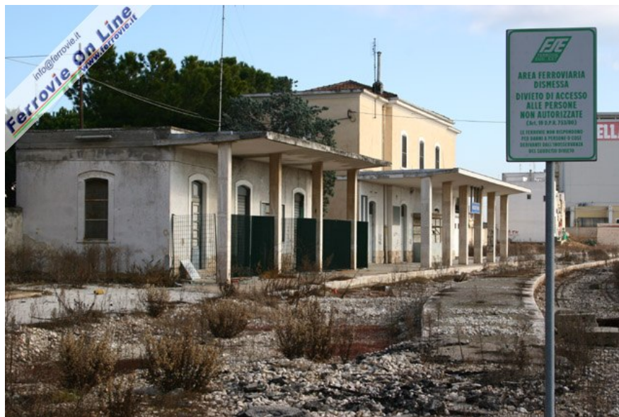
La vecchia stazione di Noicattaro, oggi abbandonata a favore del nuovo impianto che sorge a poche centinaia di metri dal precedente. Foto David Campione, 27 dicembre 2006

Nell'ambito di questi lavori, è stato anche portato a termine il raddoppio del binario tra Noicattaro e Rutigliano per complessivi 2.789 metri.