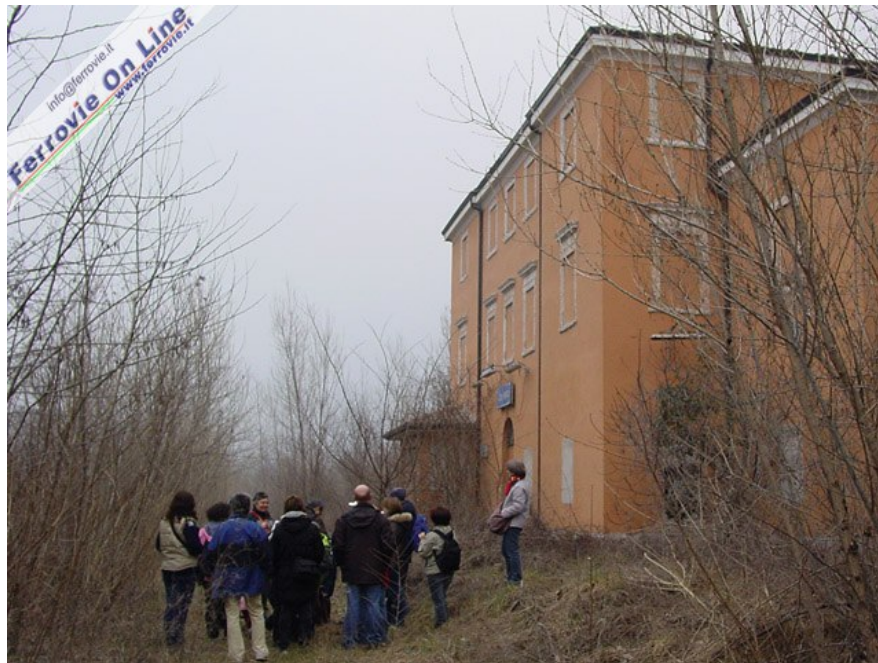
Passeggiata storico - naturalistica sull'ex tracciato della ferrovia del Brennero tra Domegliara e Dolcè (VR). Nell'immagine l'ex stazione di Ceraino, con la vecchia sede ferroviaria ormai invasa da arbusti di ogni tipo.