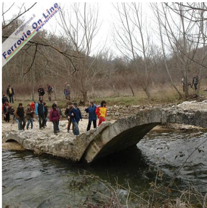
Escursione lungo la ferrovia Sulmona - L'Aquila, con attraversamento a piedi del ponte romano di Biffi. Foto Trekking in Abruzzo, 1 marzo 2009