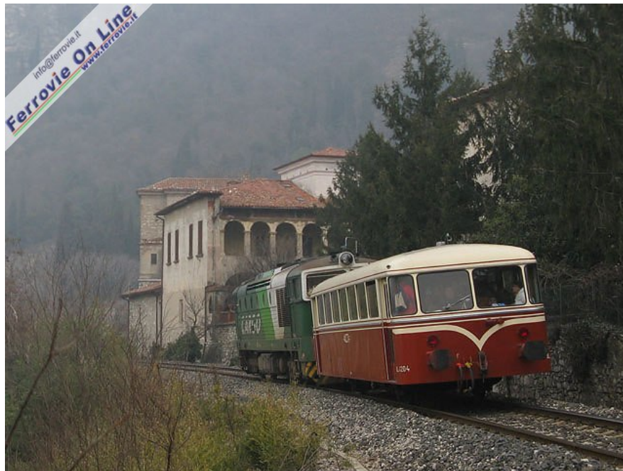
In Lombardia, a cura di F.T.I. Ferrovie Turistiche Italiane, Ferrovie Turistica Camuna, è stato organizzato un treno con l'automotrice storica Schienenbus ALn 1204 sull'itinerario Iseo - Rovato ed Iseo - Pisogne. Per un guasto improvviso la corsa su Rovato è stata effettuata al traino della DE 520-14. Nell'immagine l'insolito convoglio transita presso il monastero di San Pietro in Lamosa a Provaglio d'Iseo. (01 marzo 2009)