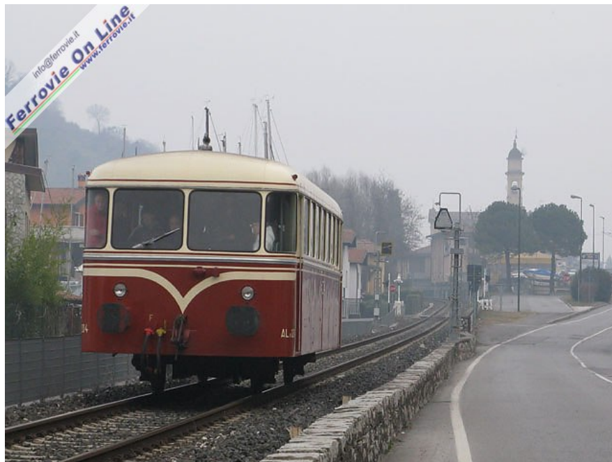
Dopo la pronta riparazione del guasto, lo Schienenbus ha potuto procedere autonomamente. Nell'immagine l'automotrice transita presso la frazione Pilzone del comune di Iseo. (Foto Guido Catasta, 01 marzo 2009)