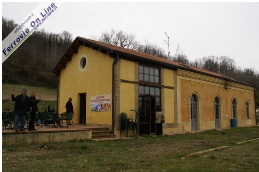
La sezione di Fermo di Italia Nostra ha organizzato delle escursioni sulla linea Porto San Giorgio-Fermo-Amandola, chiusa nel 1956. Le immagini sono relative alla ex stazione di Montefalcone, oggi di Smerillo. Il recupero del fabbricato, adibito a emporio di prodotti tipici, è stato progettato dall'architetto Giuliano Coltrinari.