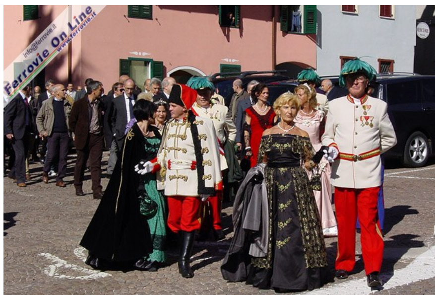
... e i figuranti in abiti d'epoca, seguiti dalle autorità. (Foto Fabio Veronesi, 11 ottobre 2009)