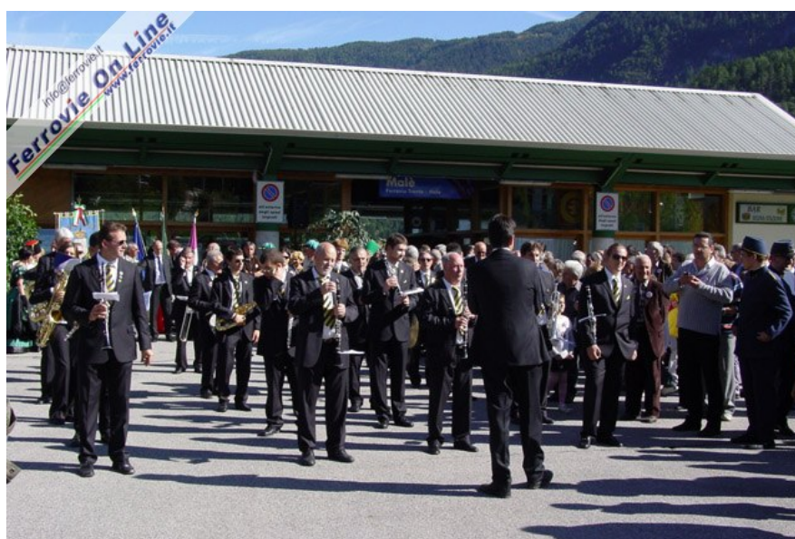
Sul piazzale della stazione di Malé, principale centro della Val di Sole, si sono tenuti i discorsi delle autorità, preceduti dalle note del Corpo Musicale "Città di Trento", che ha simbolicamente chiuso il viaggio dal capoluogo tridentino. (11 ottobre 2009)