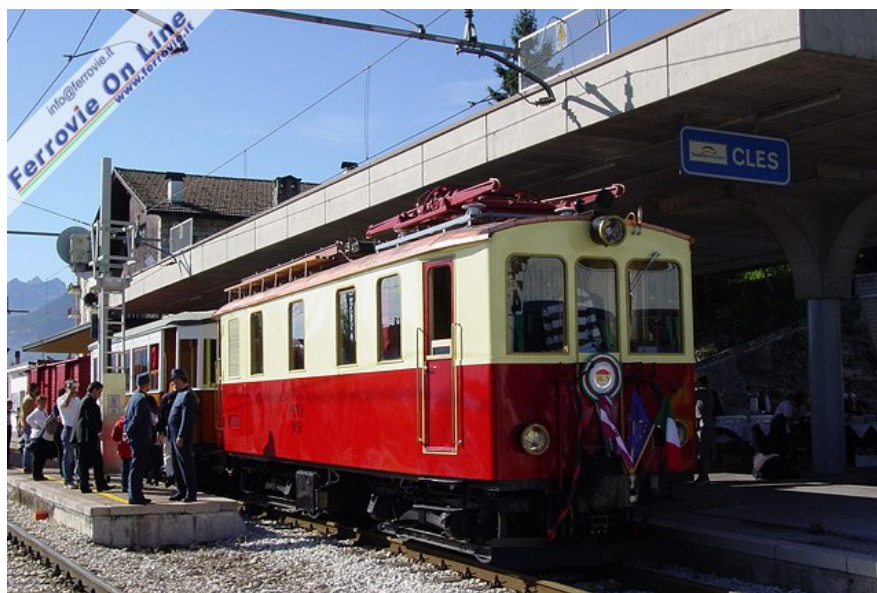
Il treno storico in sosta sul primo binario della stazione di Cles, capoluogo del Comprensorio della Val di Non. La locomotiva LC 21 è stata sganciata e ricoverata sul terzo binario in modo da non "oscurare" la storica B.51. (Foto Fabio Veronesi, 11 ottobre 2009)