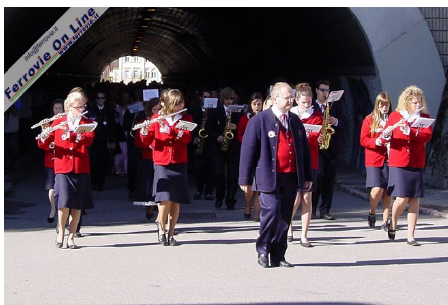
Dopo l'arrivo a Cles dei tre convogli speciali, iniziano i festeggiamenti con la banda musicale e... (Foto Fabio Veronesi, 11 ottobre 2009)