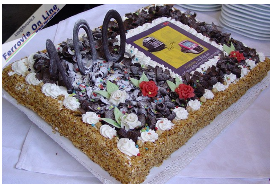
... il taglio della torta del centenario! (Foto Fabio Veronesi, 11 ottobre 2009)