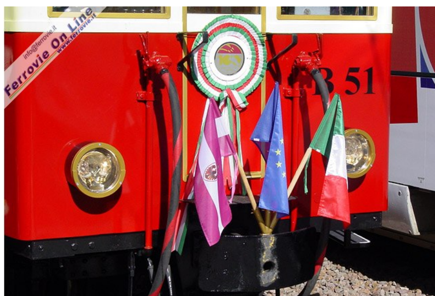
Il frontale della B.51 addobbato con le bandiere della Provincia Autonoma di Trento, dell'Unione Europea e dell'Italia. (Foto Fabio Veronesi, 11 ottobre 2009)