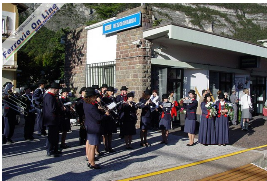
Festa sul marciapiede della stazione di Mezzolombardo con le note della Banda Cittadina. (11 ottobre 2009)