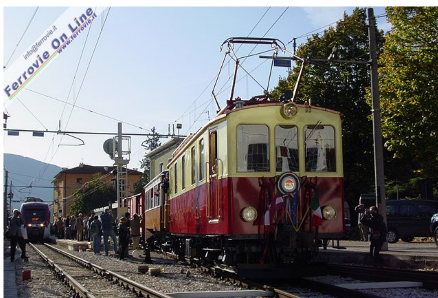
Il convoglio storico lascia la stazione di Mezzolombardo per dirigersi verso Dermulo. Sul binario di sinistra sosta il treno 384. Per riuscire ad ospitare tutti i convogli, il treno 382 - primo a seguire il treno storico - è stato ricoverato sul lungo tronchino posto oltre il secondo binario di Mezzolombardo. (Foto Fabio Veronesi, 11 ottobre 2009)