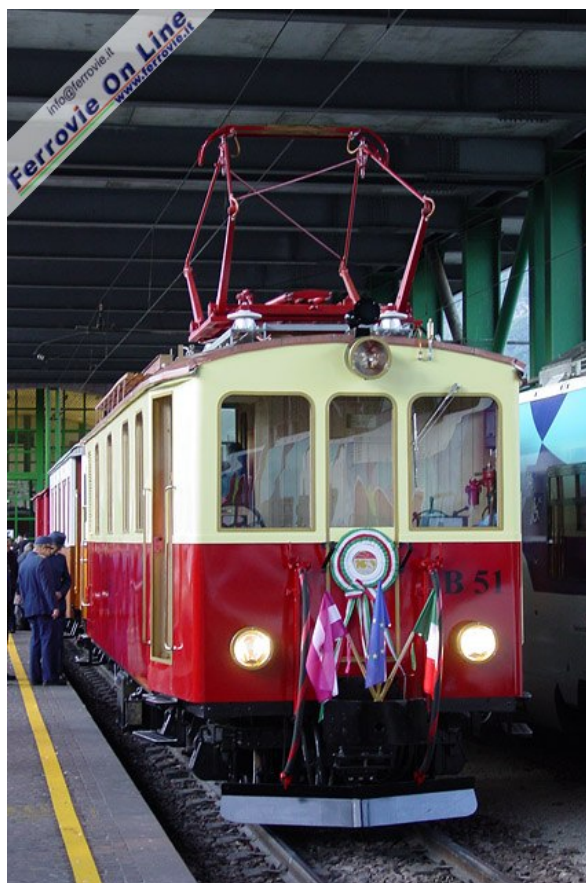
Primo piano per la locomotiva B.51, protagonista della giornata di festeggiamenti. I ristretti tempi a disposizione hanno costretto personale e volontari a compiere l'ultima corsa prova nella notte tra sabato e domenica.