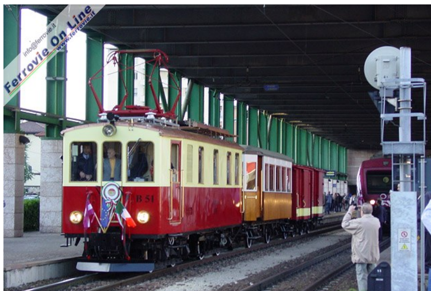
Finalmente si parte! Circondata dai fotografi, la locomotiva B.51, al traino di una carrozza e due carri a due assi, lascia la stazione di Trento. (Foto Fabio Veronesi, 11 ottobre 2009)