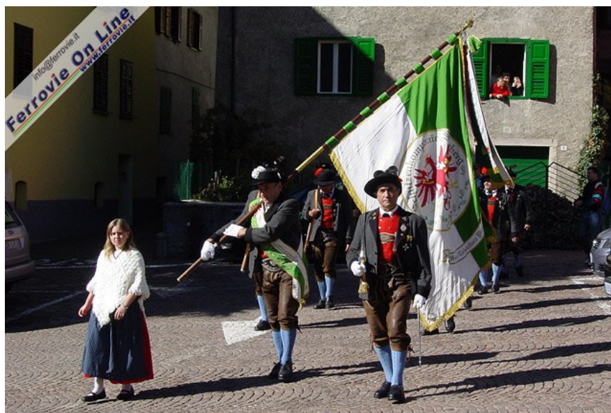
Ha poi avuto inizio la sfilata lungo le vie del paese, accompagnata dalle note della banda. Nelle immagini, la Schützenkompanie Sulzberg... (Foto Fabio Veronesi, 11 ottobre 2009)