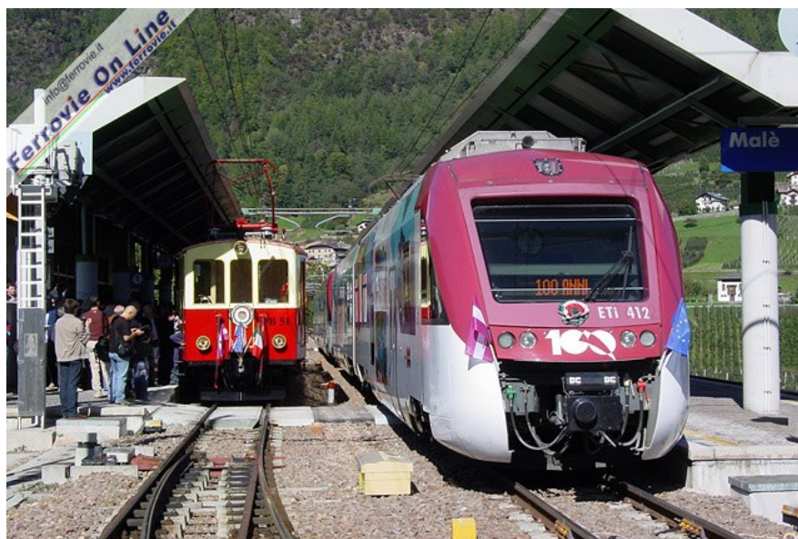
Il convoglio storico e il treno 382 sostano nella nuova stazione di Malé, realizzata contestualmente al prolungamento verso Marilleva. Curiosa la scritta "100 ANNI" sul display frontale dell'ETI 8/8 412. (Foto Fabio Veronesi, 11 ottobre 2009)