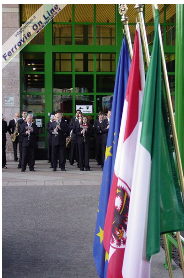
A dare ancora maggior ufficialità alla partenza del treno storico ha contribuito l'esibizione del Corpo Musicale "Città di Trento". (11 ottobre 2009)