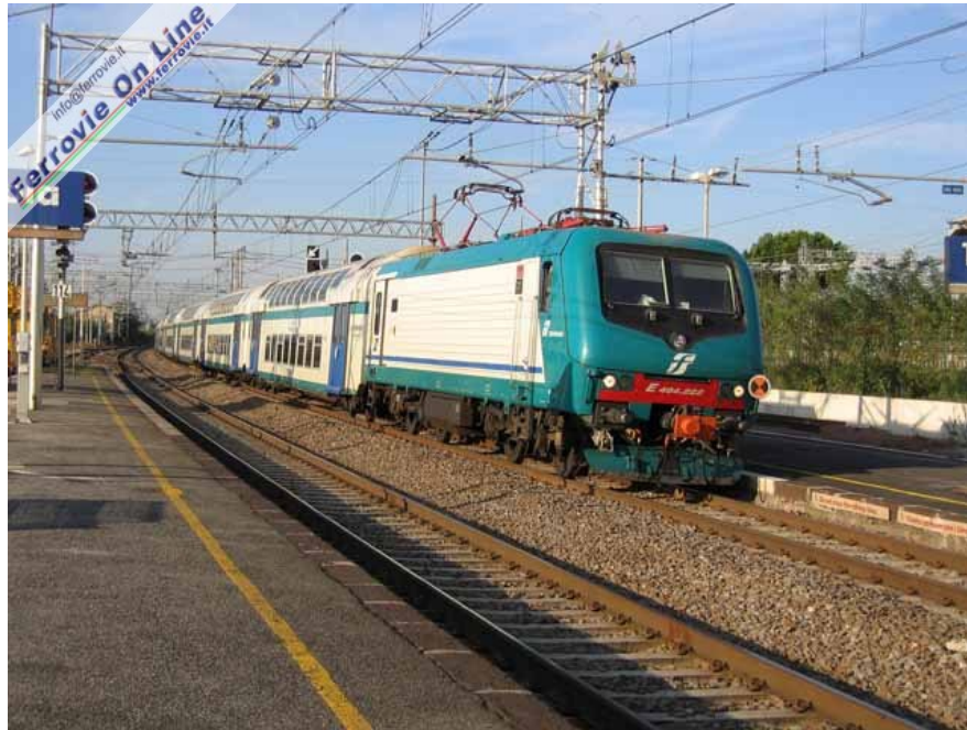
3. Qui siamo a Roma, con la E.464.002 in arrivo a Torricola al traino di un Regionale per Nettuno Foto Giancarlo Scolari, 3 novembre 2005

Le E.464 non hanno avuto solo la livrea XMPR: alcune macchine hanno avuto la livrea Vivalto, altre hanno viaggiato con quella TILO per i servizi da Milano a Chiasso mentre sono due le livree che hanno interessato le macchine per il Leonardo Express che collega Roma con l'aeroporto di Fiumicino, l'ultima presentata nei giorni (vedi News ferroviarie del 15/12/2009 ).