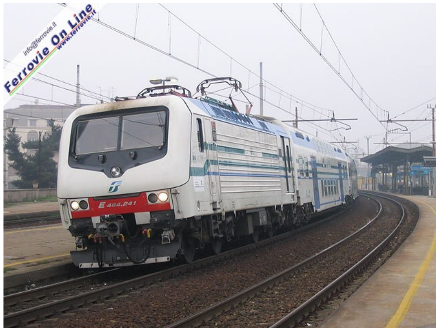
4. La E.464.241 in livrea Vivalto a Milano Lambrate. Questo è uno dei rari casi in cui la macchina con questa livrea è al traino delle vetture per cui è stata pellicolata Foto Guido Catasta, 6 novembre 2007

Per celebrare questo compleanno, lasciamo parlare le immagini delle E.464 nelle varie zone d'Italia.