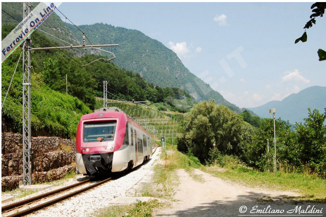
CASSANA - Tra meleti e piante di nocchie, l'ETi 407 diretto a Malè, come treno n°18, transita presso la fermata di Cassana, da dove ha inizio una delle numerose livellette presenti su questa linea. (Foto Emiliano Maldini, 10 luglio 2010)