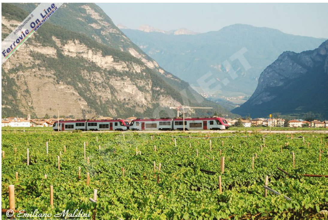
MEZZOLOMBARDO - Una coppia di elettrotreni ETi 8/8 "Orsetto" espleta il treno n°6 da Trento per Marilleva, in arrivo nella stazione di Mezzolombardo, attraversando la "Piana Rotaliana", zona ricca di vigneti con la cui uva viene prodotto il famoso vino "Teroldego", illuminata dai primi raggi di sole della giornata. (09 luglio 2010)