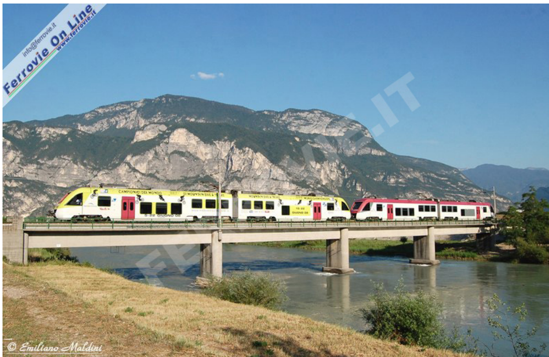
GRUMO SAN MICHELE - L'ETi 408, in livrea commemorativa per i mondiali di Mountain Bike, assieme ad un altro ETi, hanno da poco lasciato la stazione di Grumo San Michele ed attraversano il fiume Adige, dirigendosi verso Trento. (Foto Emiliano Maldini, 10 luglio 2009)