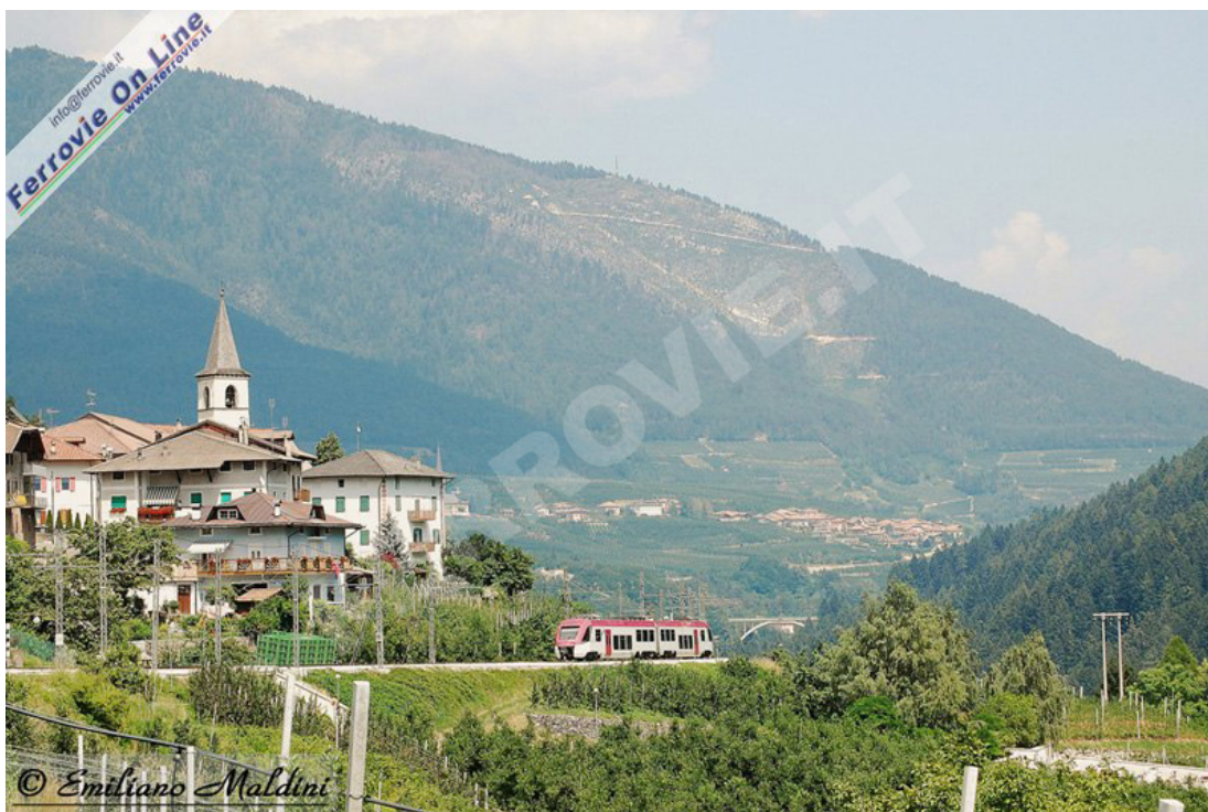
BOZZANA - BORDIANA - Dopo aver fermato nella stazione di Bozzana - Bordiana, l'ETi 407 del treno n°25 da Marilleva per Trento, transita sotto un gruppetto di case e la parrocchia della frazione di Bozzana. Sullo sfondo si può notare il viadotto di Mostizzolo, che il treno in fotografia percorrerà dopo pochi minuti. Il viadotto di Mostizzolo è, dopo quello di Santa Giustina, il secondo ponte più alto della linea. (Foto Emiliano Maldini, 10 luglio 2010)