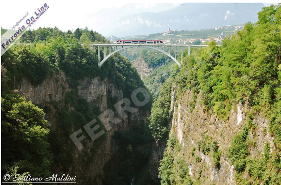
TASSULLO - Il ponte di Santa Giustina, tra le stazioni di Dermulo e Tassullo, è uno dei ponti più alti della linea ed è posto in corrispondenza della omonima diga (posta alle spalle del fotografo). Su questo ponte vediamo transitare l'ETi 401, diretto a Marilleva come treno n°12. (Foto Emiliano Maldini, 10 luglio 2010)