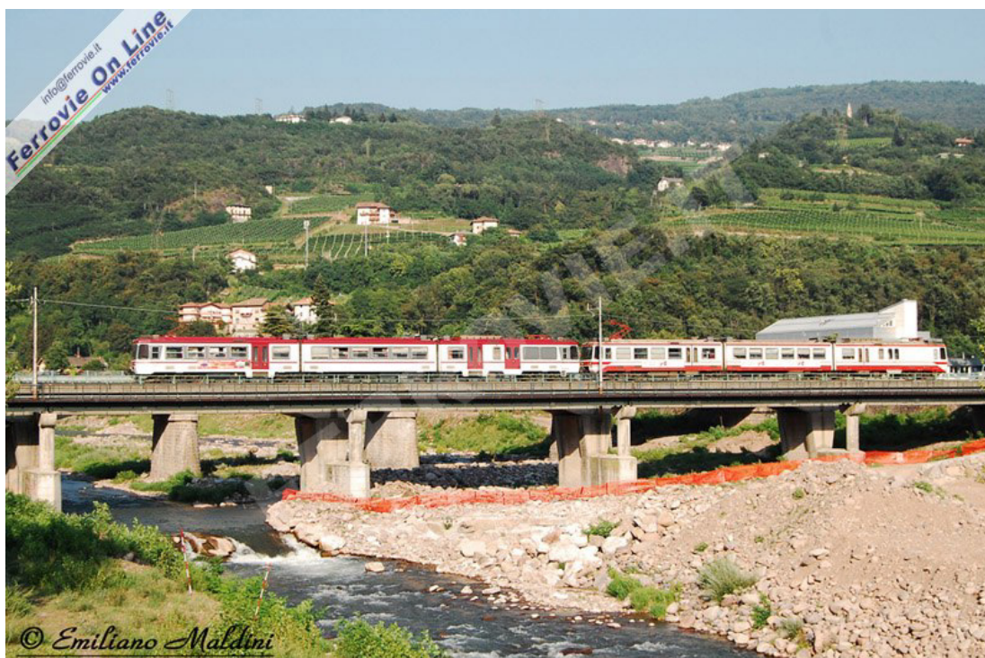
LAVIS - Gli elettrotreni ET 15 ed ET 16, diretti a Trento, stanno attraversando il ponte sul torrente Avisio, dopo aver effettuato la fermata a Lavis, nel tardo pomeriggio di Venerdì 9 Luglio 2010.

Lasciamo quindi spazio alle immagini che meglio di mille parole descrivono la bellezza di questa splendida linea attraverso la Val di Non, famosa per le sue mele, e la Val di Sole per giungere ai quasi 900 metri di Marilleva dopo 66 km.