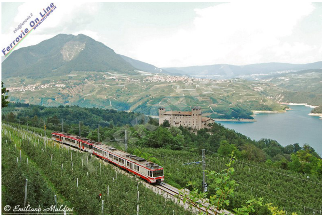
CLES - Castel Cles ed il lago di Santa Giustina fanno da quinta al transito della coppia di elettrotreni ET 15 ed ET 16, diretti a Marilleva, come treno n°22, che tra pochi istanti effettuerà fermata nella stazione di Cles. (Foto Emiliano Maldini, 10 luglio 2009)