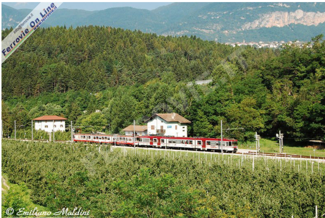
DENNO - Dopo Mezzolombardo, la linea si sviluppa attraverso un paesaggio più aspro e spettacolare, il treno n° 40 da Trento per Marilleva, effettua una breve fermata nella piccola stazione di Denno dove possiamo ammirare l'elettrotreno ET 16 nella nuova livrea ispirata agli ETi 8/8, accoppiato all'ET 15, ancora in livrea originaria. (Foto Emiliano Maldini, 09 luglio 2010)