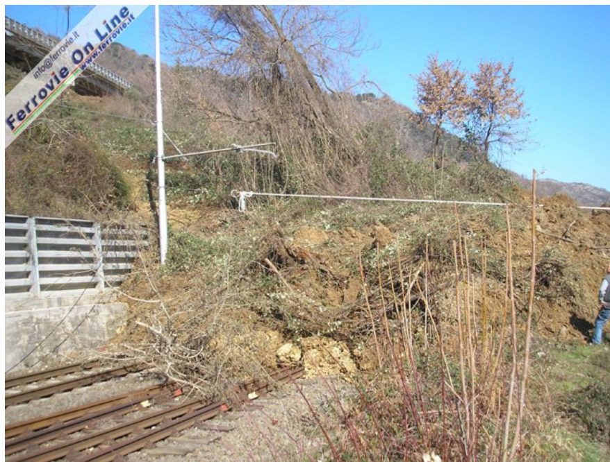
5. Gli ingenti danni causati dalla frana, in uscita lato Roma dalla stazione di Arsoli sulla linea Roma - Sulmona. 14 marzo 2010

La disastrosa situazione idrogeologica in Italia crea non pochi problemi alle nostre linee ferroviarie. A metà marzo una frana interrompe per qualche giorno la Roma - Sulmona all'altezza di Arsoli. Ben più grave è la situazione sulla Foggia - Benevento per la frana di Monteaguto. Sarà riaperta solo dopo quasi tre mesi ( Brevi ferroviarie del 07/06/2010 ).