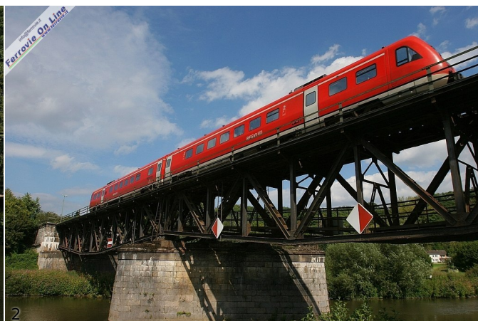
1. RB Limburg - Coblenza presso Balduinstein (Foto Paolo De Pasqual, agosto 2011)