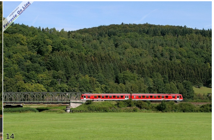
14. RB Limburg - Giessen nei pressi di Solms, alle porte di Wetzlar (Foto Paolo De Pasqual, agosto 2011)

Da Wetzlar, notevole città d'arte su cui spicca il duomo rimasto incompiuto dal 1400, si può proseguire in bicicletta o treno per qualunque destinazione della Germania.