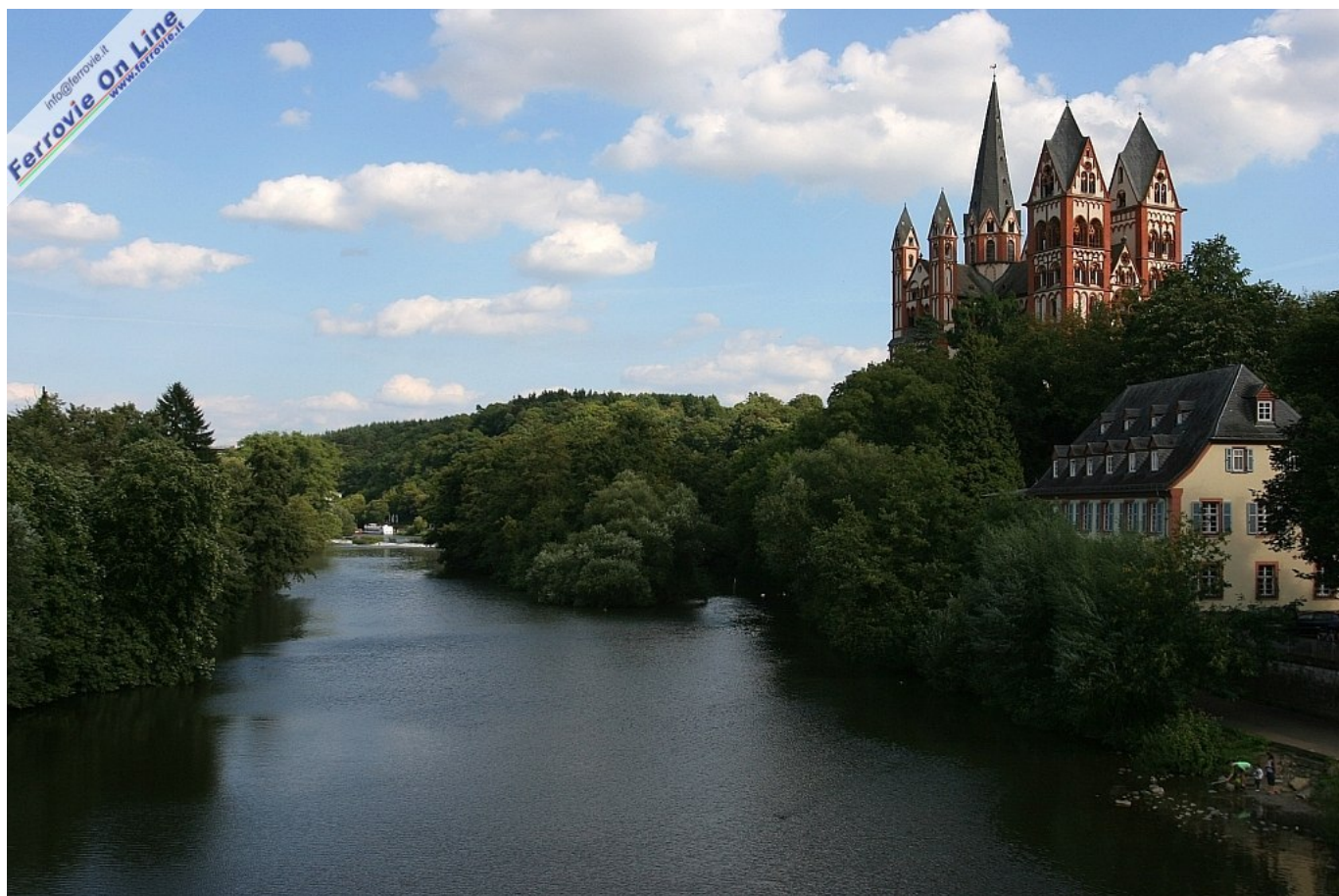
3 Il caratteristico aspetto della città di Limburg an der Lahn (Foto Paolo De Pasqual, agosto 2011)

Proseguendo verso Weilburg la valle si fa più ampia, la linea segue il corso sinuoso del fiume con ampie curve, sempre affiancata dalla pista ciclabile.