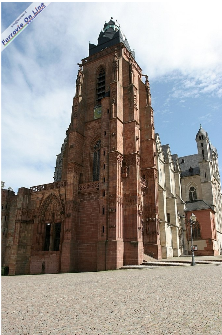
15 Il duomo di Wetzlar, del 1200, ricostruito a partire dalla fine del '300 e rimasto incompiuto (Foto Paolo De Pasqual, agosto 2011)

La pista ciclabile della valle può essere percorsa sia partendo da Coblenza sia da Wetzlar, in due o tre giorni, il percorso è piacevole e pressoché pianeggiante, salvo il tratto Laurenburg - Balduinstein come già scritto.