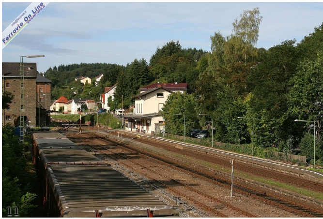
11. Löhnberg: la stazione, in primo piano carri adibiti al trasporto dell'argilla (Foto Paolo de Pasqual, agosto 2011)