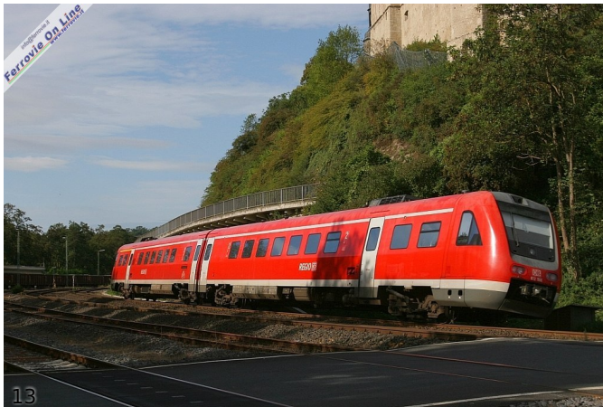
13. Transito in velocità di un RE Giessen - Coblenza

Mancano ormai pochi chilometri, la valle si allarga ulteriormente; questo RB si appresta ad entrare a Wetzlar, dove ha termine la linea.