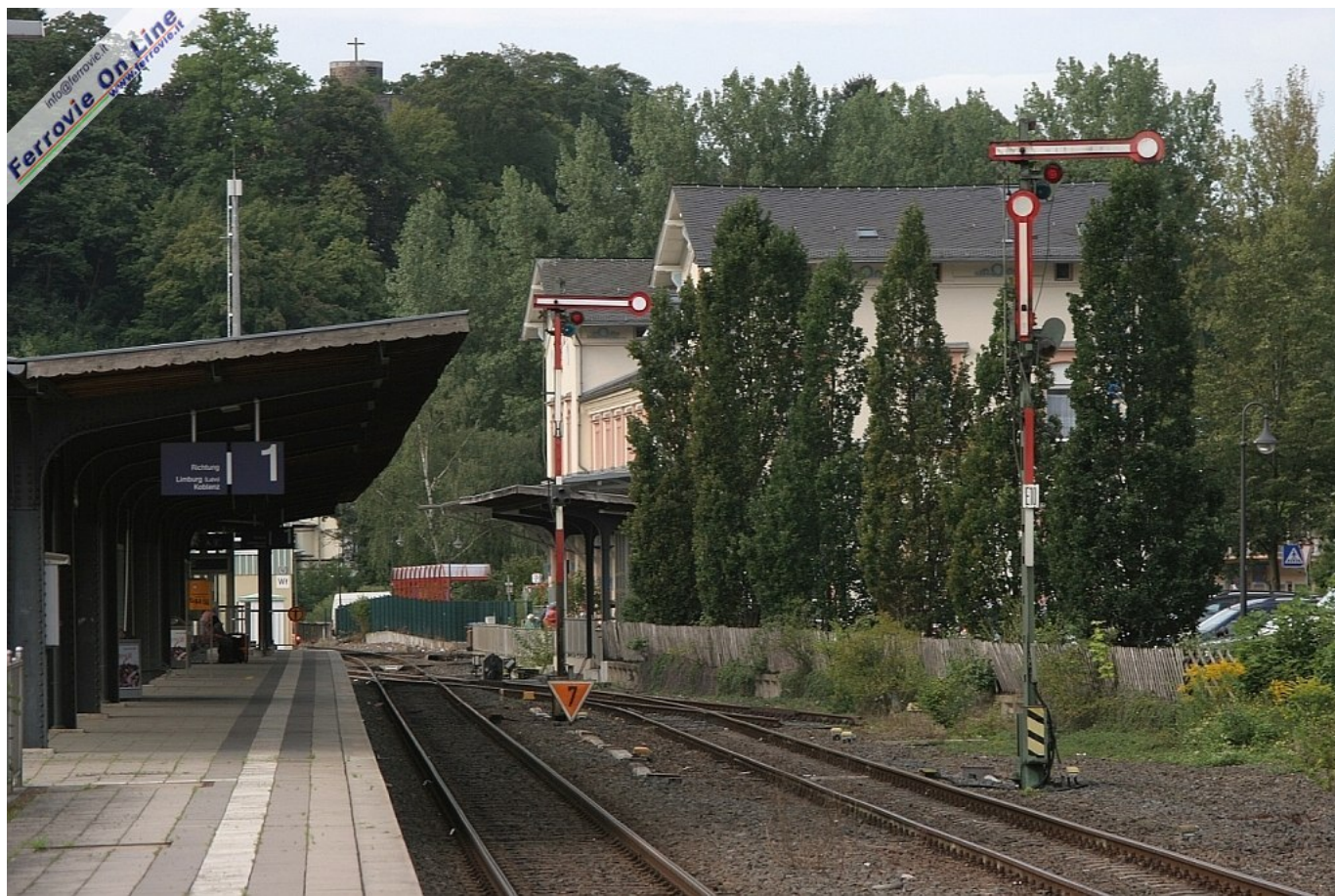
10. Weilburg: la stazione

Tariffe convenienti, custodia delle biciclette e attrezzature per eventuali riparazioni sono il segno dell'ospitalità della zona.