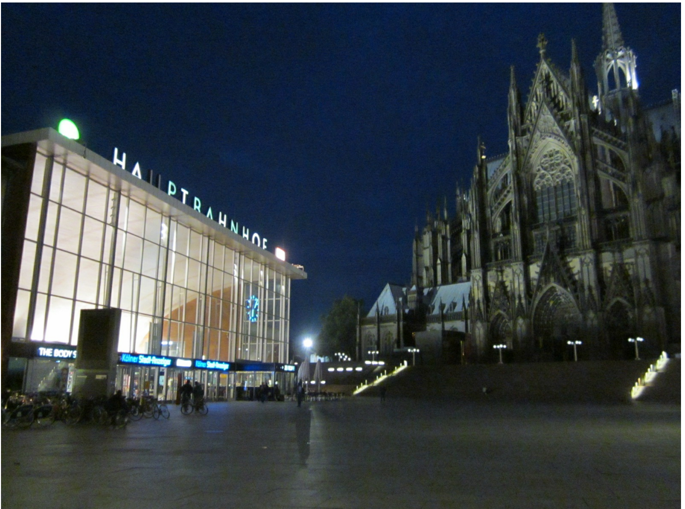
9. Il piazzale di fronte a Köln Hbf: da un lato la modernità dell'edificio della stazione, dall'altro le guglie gotiche del Duomo.

Il prestante treno, caratterizzato da un notevole spunto in accelerazione, corre per lunghi tratti alla velocità massima di 160 Km/h attraversando la Vestfalia sotto le prime luci dell'alba e quindi la popolosa regione della Ruhr. Puntuali si arriva a Düsseldorf, Duisburg, Essen, Gelsenkirchen, Münster e Osnabrück. Il treno, in partenza da Colonia semivuoto, si riempie a mano a mano in ogni stazione e dopo Osnabrück è praticamente al completo. La clientela è della più varia: giovani che viaggiano per un week end all'insegna del risparmio, studenti di rientro dalle sedi universitarie, famiglie al completo, coppie di anziani. Questo è indice del gran successo che questo servizio ha avuto immediatamente e che è destinato a crescere: solo nel primo mese di attività sono stati trasportati circa 25.000 passeggeri.