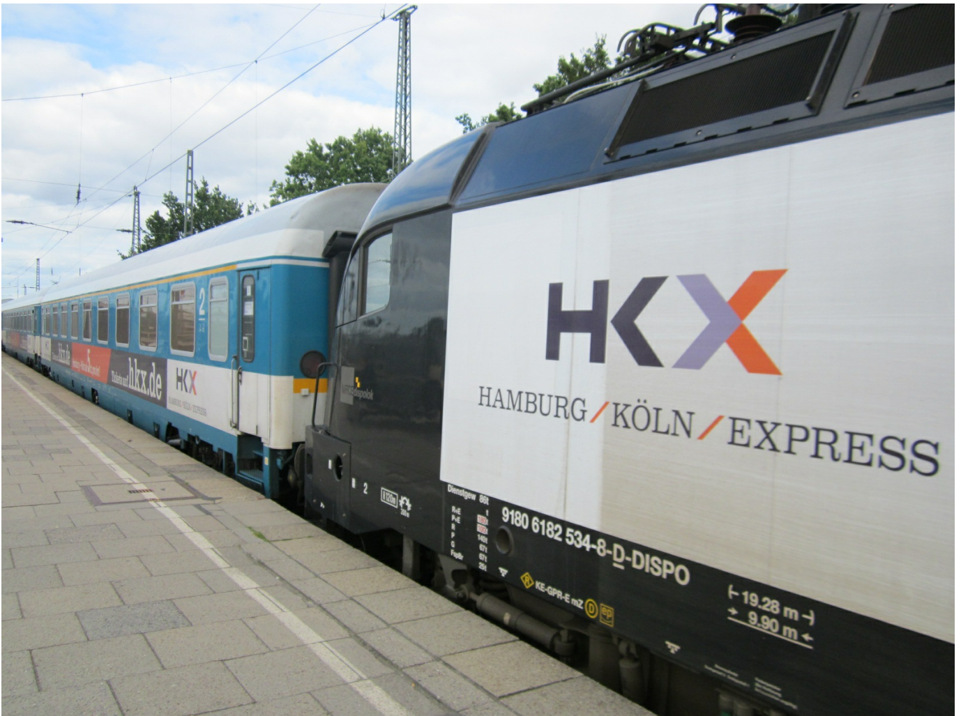
30. Visione del convoglio titolare dei servizi del Hamburg-Köln-Express durante tutto l'arco della settimana. Il treno HKX 1803 è appena giunto da Colonia al traino della locomotiva ES64U2-034 e tra pochi minuti ripartirà per Colonia come HKX 1804. (Foto Mirco Brondolin, 01 settembre 2012)

Ogni carrozza ha nove scompartimenti con sei poltrone ciascuno. Due scompartimenti fra la seconda e la terza carrozza sono riservati al personale di bordo e al servizio minibar, che su questo treno è svolto anche su un carrellino che percorre più volte durante il viaggio le quattro carrozze. Il materiale ha i suoi anni, ma è ben tenuto: la pulizia e i tessuti sono in ottime condizioni e sono stati apposti dei poggiatesta nuovi con il logo della compagnia. Il comfort di viaggio è comunque quello di una vettura che risale agli anni Settanta e si sente: durante tutto il viaggio gli sbalzi sono notevoli, però le poltrone molto più comode rispetto a quelle dell'andata permettono di rilassarsi un po' di più.