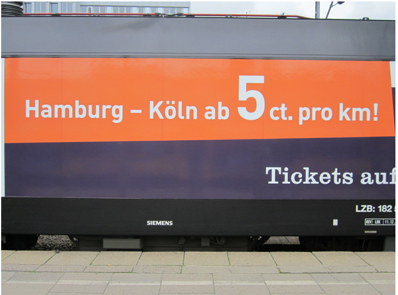
10. La fiancata della locomotiva ES64U2-030 con la pubblicità delle tariffe del Hamburg-Köln-Express a partire da 5 centesimi/km. 1 settembre 2012

troppo anticipo: appena 10 giorni prima della partenza, sia per l'andata che per il ritorno abbiamo trovato offerte a 20 euro, sebbene in un caso il treno risultasse prenotato per oltre il 60% e nell'altro per oltre l'80%. Inoltre, sul biglietto di ritorno, per chi procede al suo acquisto congiuntamente al biglietto di andata, è riservato un ulteriore sconto del 10%. Risultato: Colonia-Amburgo A/R a 38 euro.