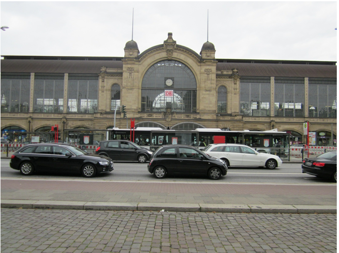
15. La facciata esterna della stazione di Hamburg Dammtor: si noti la perfetta integrazione con gli altri mezzi di trasporto pubblici. Una lunga corsia riservata agli autobus si trova proprio appena fuori l'ingresso principale. (Foto Mirco Brondolin, 01 settembre 2012)

Proseguendo nel nostro viaggio, lasciamo il Nordreno Vestfalia per entrare nella Bassa Sassonia e si effettua l'ultima fermata a Osnabrück. Poi seguono oltre un'ora e quaranta minuti senza altre fermate e si arriva direttamente ad Amburgo dove viene effettuato servizio viaggiatori nelle stazioni di Harburg, Hauptbahnhof, Dammtor e Altona. A dicembre 2012, quando è prevista la fine dei lavori sulla linea fra Münster e Brema, è prevista un'ulteriore fermata a Sagehorn a servizio della città anseatica.