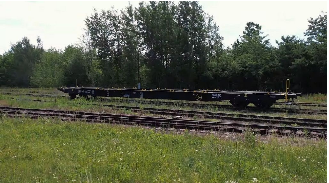
1 1

Atto a circolare sino alla velocità di 120 km/h, il carro è caratterizzato da un peso complessivo di 90 tonnellate (peso assiale 22,5 t), carrelli di tipo Y25Ls e capacità di iscrizione in curva sino a 90 metri di raggio.