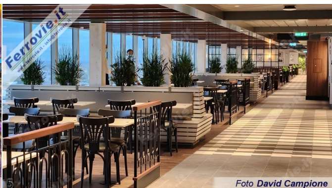
4/5. Foto David Campione, 16 novembre 2022