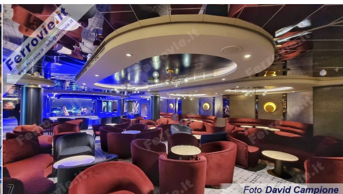
6/7. Foto David Campione, 16 novembre 2022