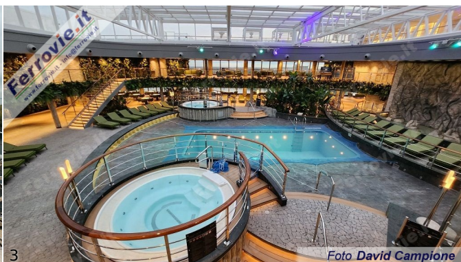
2/3. 16 novembre 2022

Battesimo a New York, due itinerari ai Caraibi