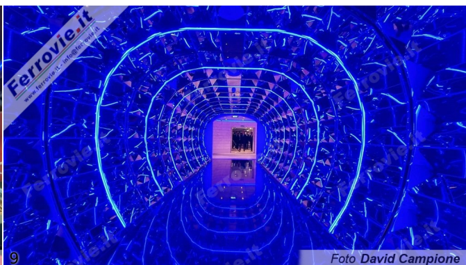
8/9. 16 novembre 2022

Comunicato stampa MSC Crociere - Fincantieri - 16 novembre 2022