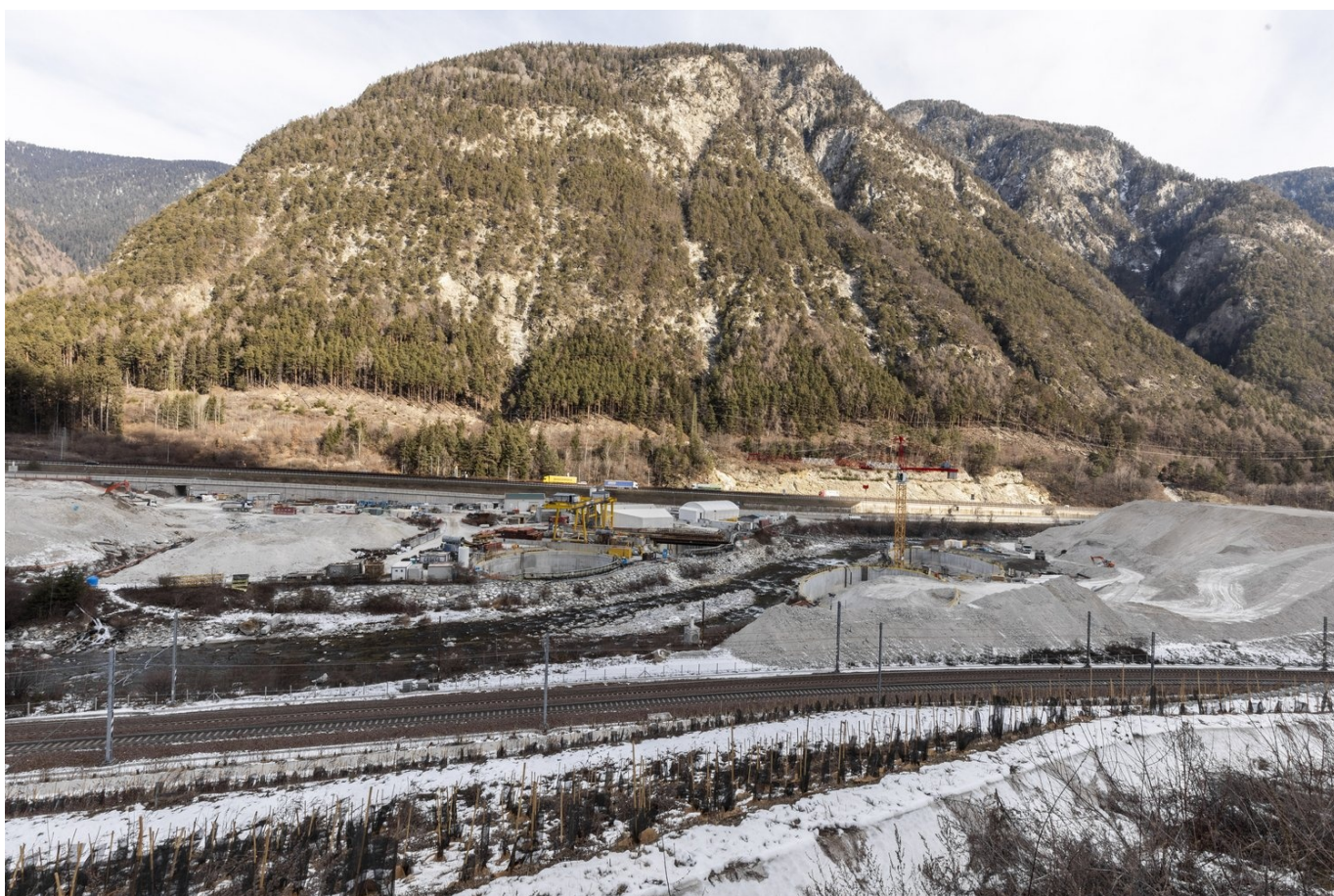
1 Foto BBT

In questo lotto costruttivo, per poter scavare sotto il fiume con la tecnica del consolidamento mediante congelamento del terreno, sono stati realizzati due pozzi su ciascun lato del fiume, della profondità di circa 25 metri ciascuno. La tecnica del congelamento è una tecnica di consolidamento ecocompatibile, ed è stata scelta per poter mantenere il fiume Isarco nel suo alveo originale, preservando al tempo stesso la flora e la fauna di questa zona.