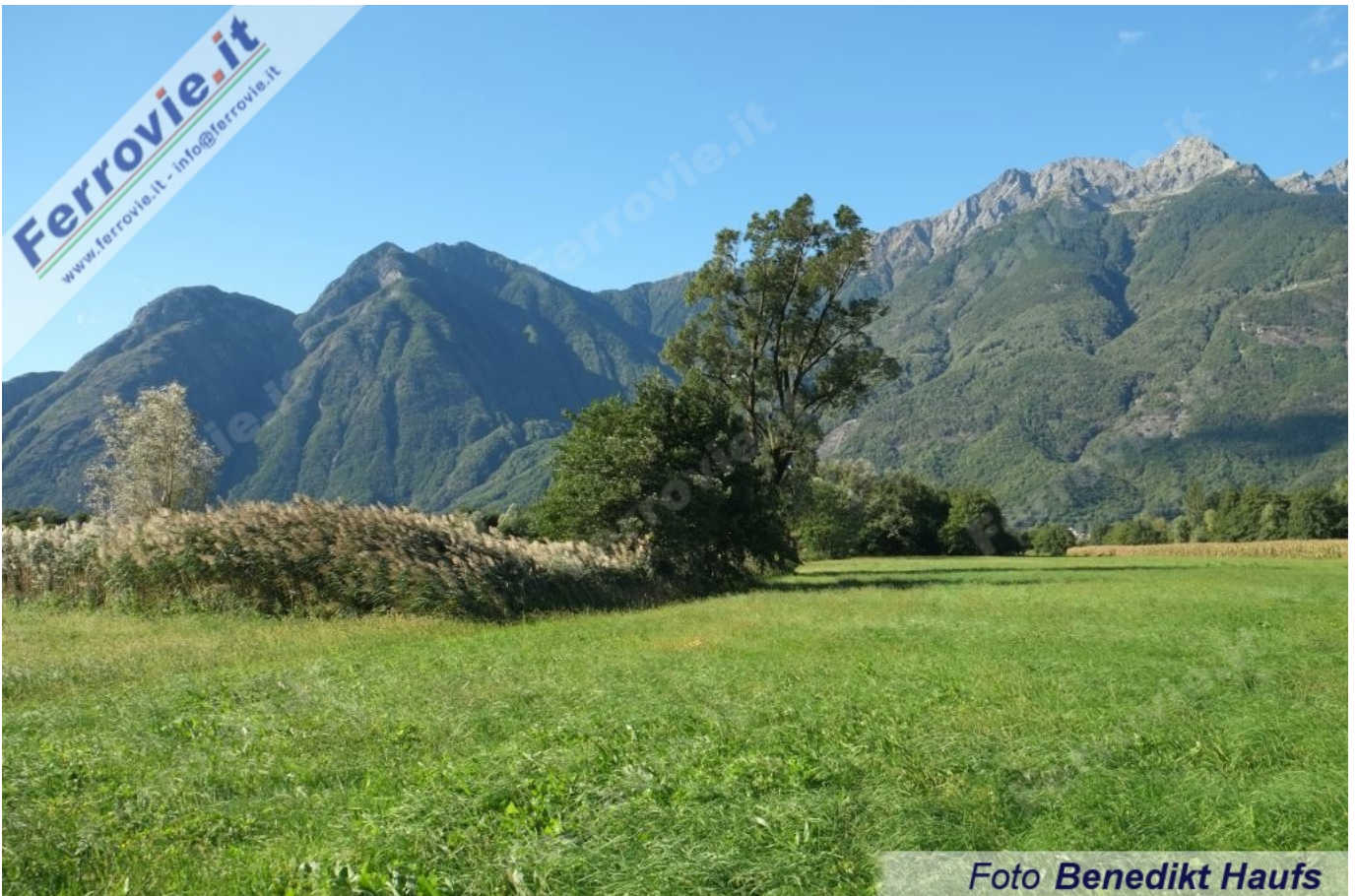
2 2 Il Piano di Chiavenna tra Samolaco e San Cassiano. (Foto Benedikt Haufs, 17 settembre 2022)

Questa linea ferroviaria da Colico a Chiavenna era stata progettata con grandi ambizioni come parte di una trasversale alpina da Milano a Coira attraverso il passo dello Spluga, che non è mai stata realizzata (vedi Approfondimenti del 03/10/2022 ) e nei primissimi anni del Novecento è stata, insieme alla Colico - Sondrio appena percorsa, la prima ferrovia italiana elettrificata con l'allora rivoluzionario sistema trifase a 3000 V. Oggi, questa linea elettrificata di 27 chilometri viene gestita come linea solamente regionale con elettrotreni moderni. Purtroppo, la linea è poco conosciuta anche dagli stessi appassionati di ferrovie.