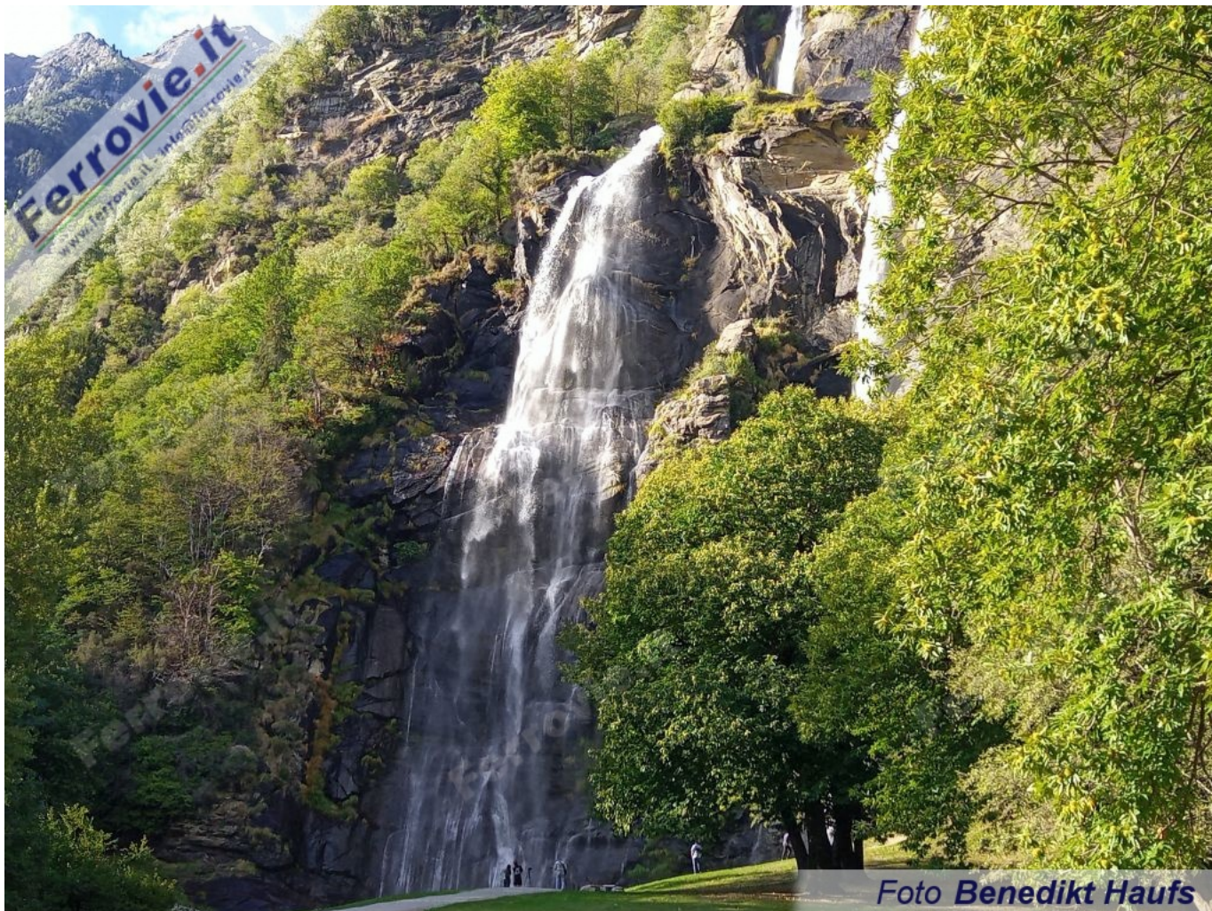
44 Le Cascate dell'Acquafraggia a Piuro. (Foto Benedikt Haufs, 17 settembre 2022)

Ovviamente, si potrebbe intraprendere questo viaggio di un giorno anche nell'altra direzione. E invece di St. Moritz, sono possibili punti di partenza anche le stazioni ferroviarie di Chiavenna, Coira oppure Milano. Noi abbiamo descritto il giro in questa direzione - geograficamente in senso orario - in base alle condizioni di luce, poiché così il Massiccio del Bernina si sveglia nell'alba e le Cascate dell'Acquafraggia scrosciano nella luce mite della sera.