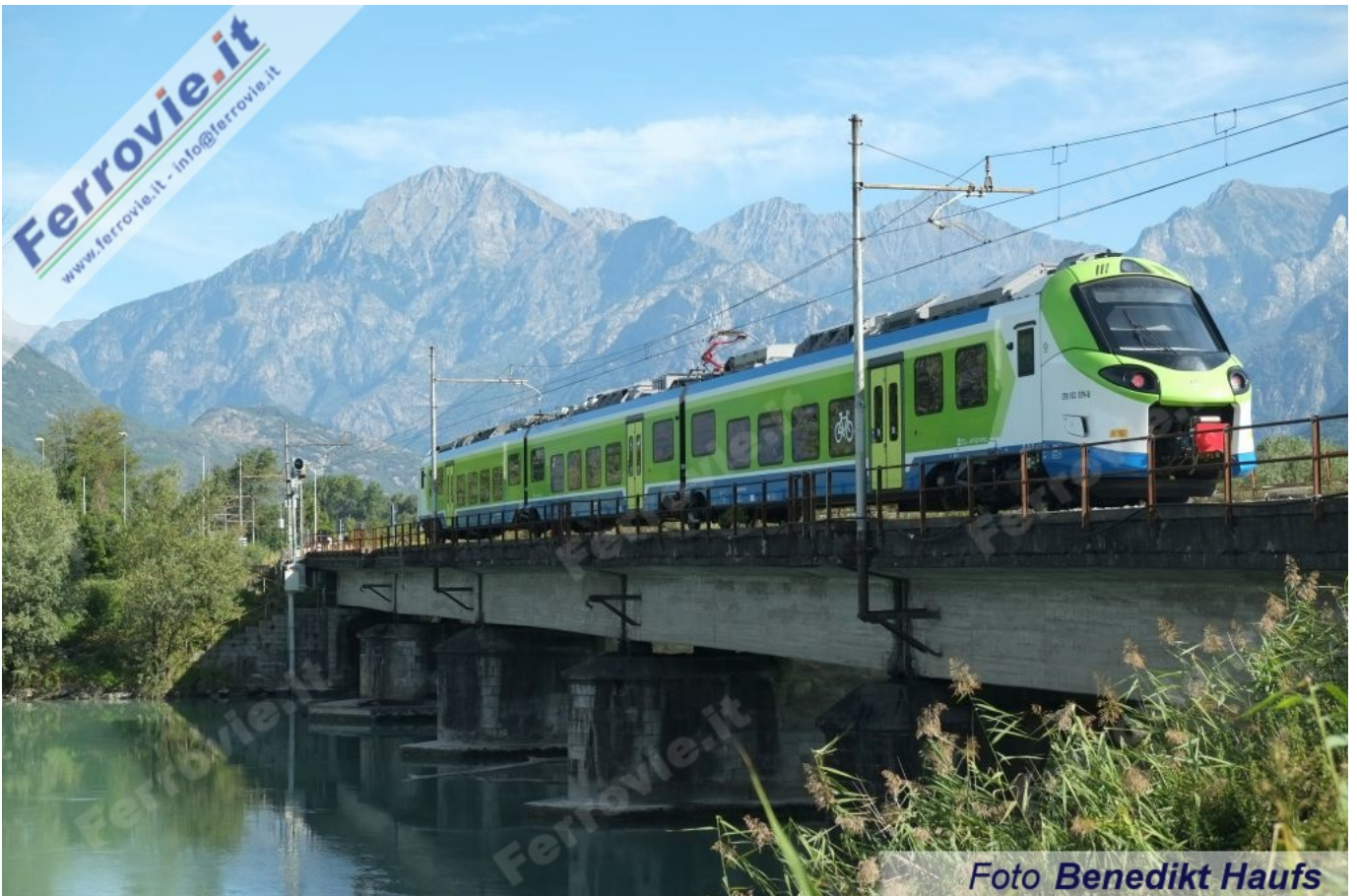
55 Il Donizetti ETR.103-029 di Trenord attraversa il ponte sul fiume Adda in servizio regionale da Colico a Chiavenna. Foto Benedikt Haufs, 13 settembre 2022