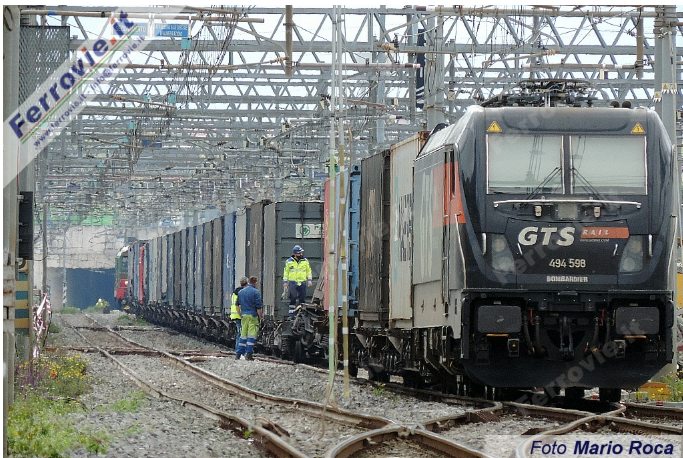
1 20 aprile 2023

In un comunicato GTS Rail informa che la stessa non è responsabile della manutenzione del carro, trattandosi di un veicolo non di sua proprietà (vedi Brevi ferroviarie del 20/04/2023).