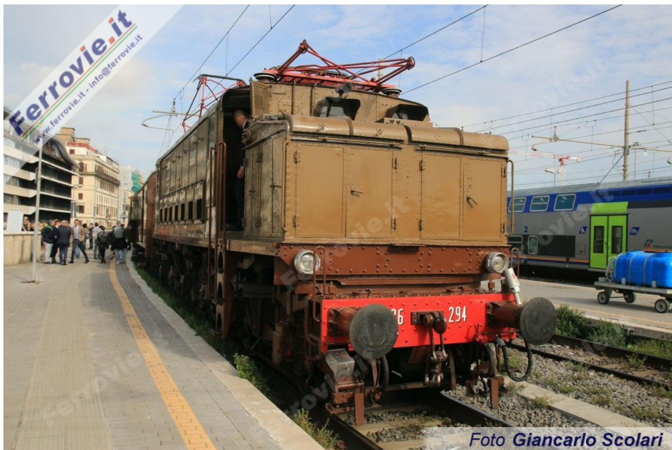
4 29 aprile 2023

Cantamessa, durante la conferenza stampa, ha ricordato quanto ha fatto Fondazione FS Italiane in questi primi 10 anni di vita, con 400 mezzi attivi tra locomotori elettrici, locomotive Diesel, elettrotreni, automotrici e vetture con l'obiettivo di rendere un'offerta stabile ogni weekend di treni storici verso importanti mete turistiche e paesaggistiche con un occhio all'enogastronomia locale. L'Onorevole Federico Mollicone ha ringraziato Fondazione FS che "racconta la storia e l'identità dell'Italia e valorizza il turismo lento per portare i romani negli itinerari minori che minori non sono" annunciando tra l'altro il raddoppio dei fondi stanziati per la rievocazione storica. Sulla stessa linea il Senatore Nicola Calandrini nel voler ringraziare l'operato di Fondazione FS al quale va il merito di valorizzare territorio.