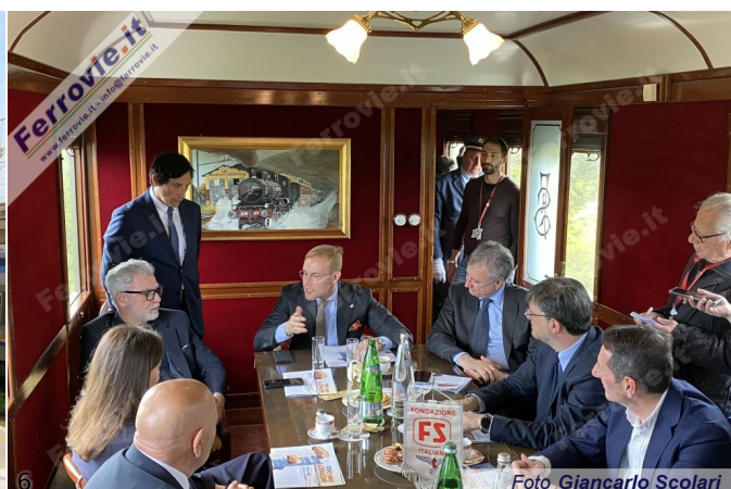
5/6. 29 aprile 2023

Una volta giunti a Latina, il Direttore Generale di Fondazione FS, Luigi Cantamessa, l'Onorevole Federico Mollicone e il Senatore Nicola Calandrini hanno inaugurato nei locali della sala d'attesa di prima classe della stazione la mostra "La Stazione di Latina e il mito della Littorina" che sarà visitabile gratuitamente fino al prossimo 31 dicembre.