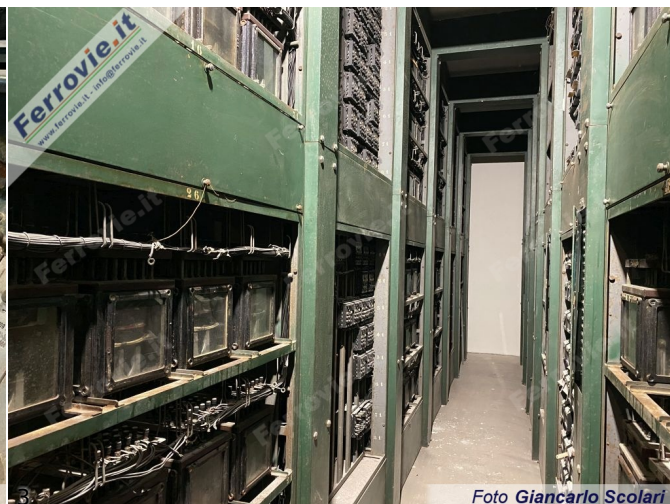
2/3. Foto Giancarlo Scolari, 29 aprile 2023

Una volta visitato il bunker sotterraneo della Cabina ACE, viaggiatori paganti, ospiti e giornalisti sono saliti sul treno storico composto da carrozze Centoporte, una carrozza CZ 31000, la vettura "Grillo" e un bagagliaio a due assi trainate dalla locomotiva E.626.294 che ha lasciato il binario 29 di Roma Termini alla volta di Latina come Treno Storico 96245.