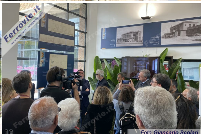
7/8/9/10. 29 aprile 2023