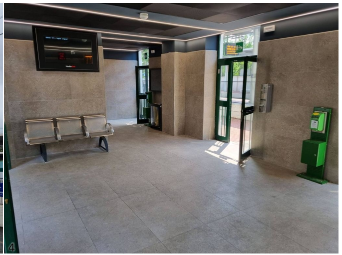
3/4. Stazione di Varedo.

"L'intervento - dichiara Claudia Maria Terzi, Assessore alle Infrastrutture e Opere Pubbliche di Regione Lombardia - rientra nel più ampio progetto di rifacimento di 29 stazioni sulle linee Milano - Asso e Saronno - Como, finanziato da Regione Lombardia con 11,5 milioni di euro ed è volto a migliorare l'accessibilità e la fruibilità delle stazioni. Siamo molto soddisfatti di come sta procedendo il piano di rifacimento: l'obiettivo è portare a termine gli interventi programmati nel 2024, consegnando agli utenti stazioni maggiormente accessibili, più confortevoli e sicure".