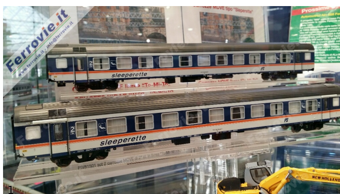
1. Set carrozze Sleeperette Vittrains - Pirata Models 2. Carrozza MDVE nella livrea Mi-To-Mi.

Pirata, la dinamica azienda bresciana inizialmente attiva nella sola scala N e che recentemente ha ampliato la propria gamma di prodotti con diversi modelli italiani in scala H0, ha siglato un accordo con la Vittrains per la produzione in esclusiva di materiale rotabile in H0, con particolare attenzione per le nostre FS e ferrovie secondarie.