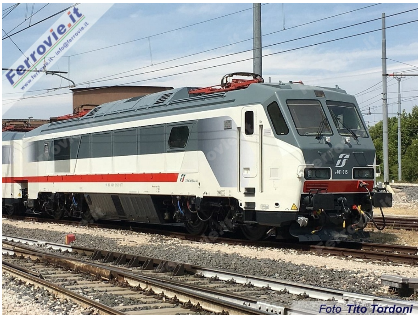
5 a E.401.015 - Foligno. (Foto Tito Tordoni, 21 luglio 2017)