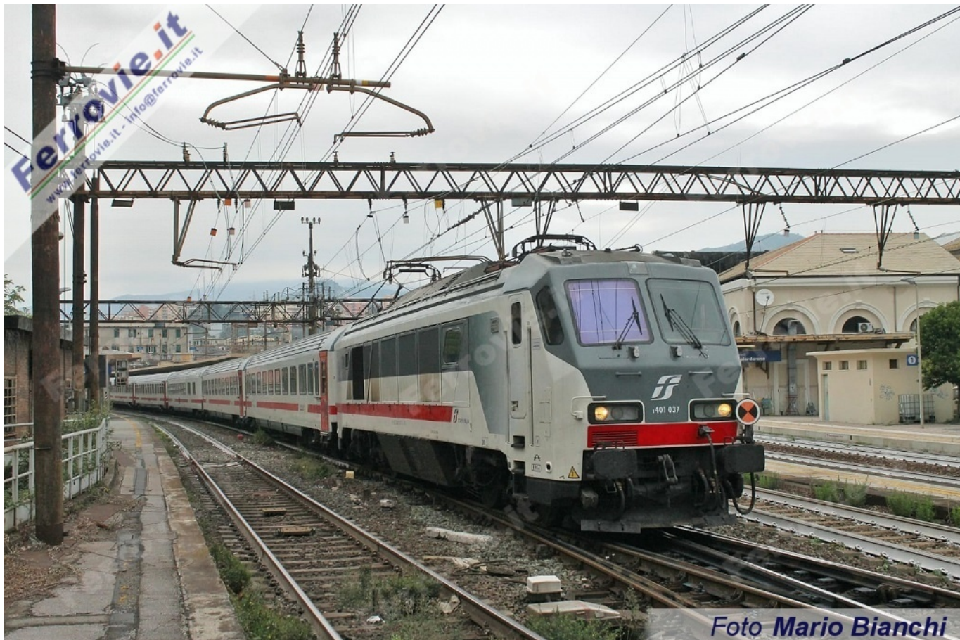
77 E.401.037 - Genova Sampierdarena. (Foto Mario Bianchi, 18 settembre 2019)