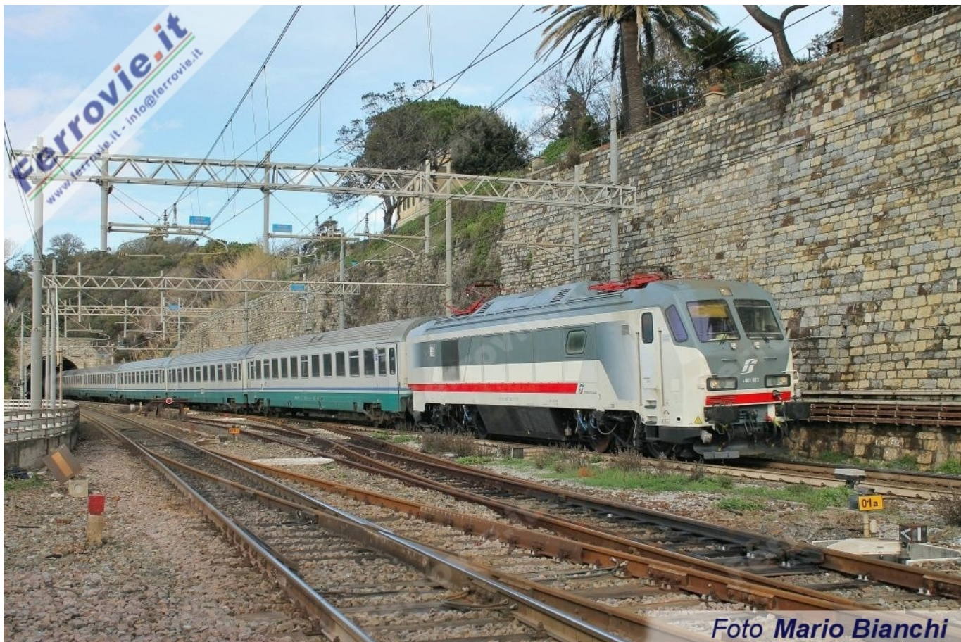
66 E.401.022 - Genova Quarto dei Mille. (Foto Mario Bianchi, 07 febbraio 2018)