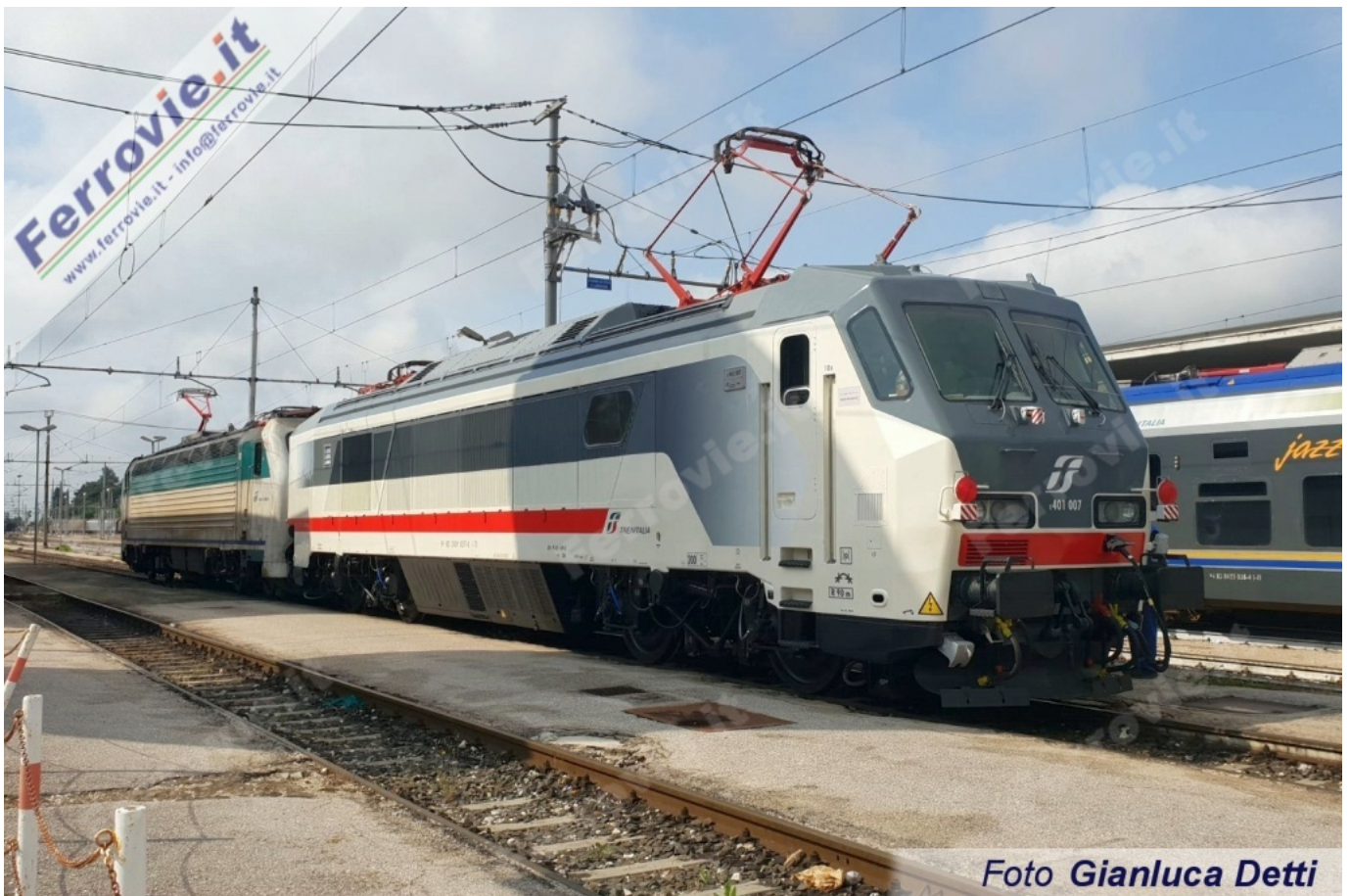
1 E.401.007 - Foligno. (Foto Gianluca Detti, 09 maggio 2018)

Collabora inviandoci le tue foto alla nostra email info@ferrovie.it oppure taggaci su Facebook e Instagram con @ferrovie.it