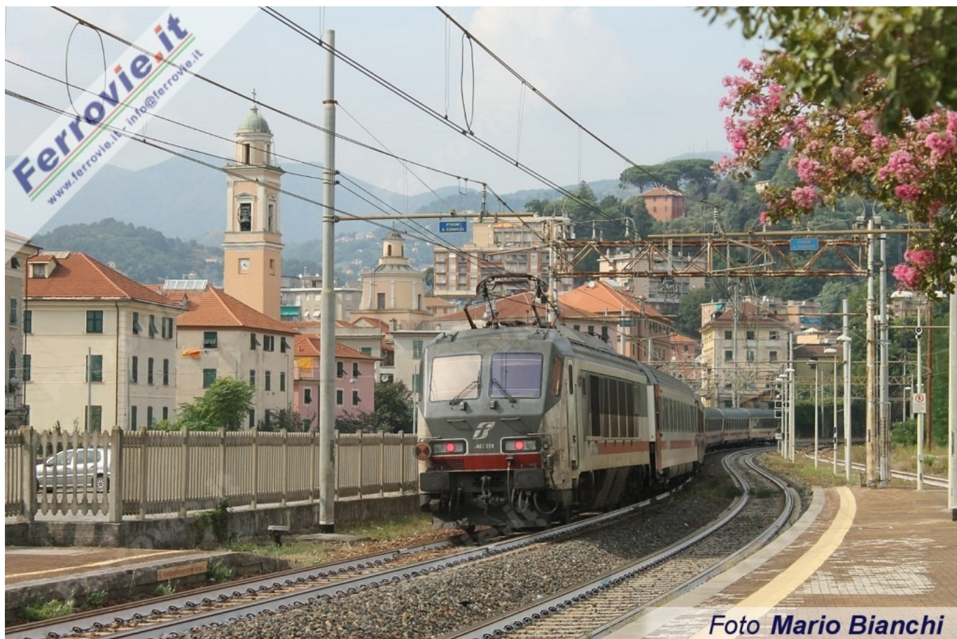
4 a E.401.014 - Genova Pontedecimo. (Foto Mario Bianchi, 27 agosto 2019)