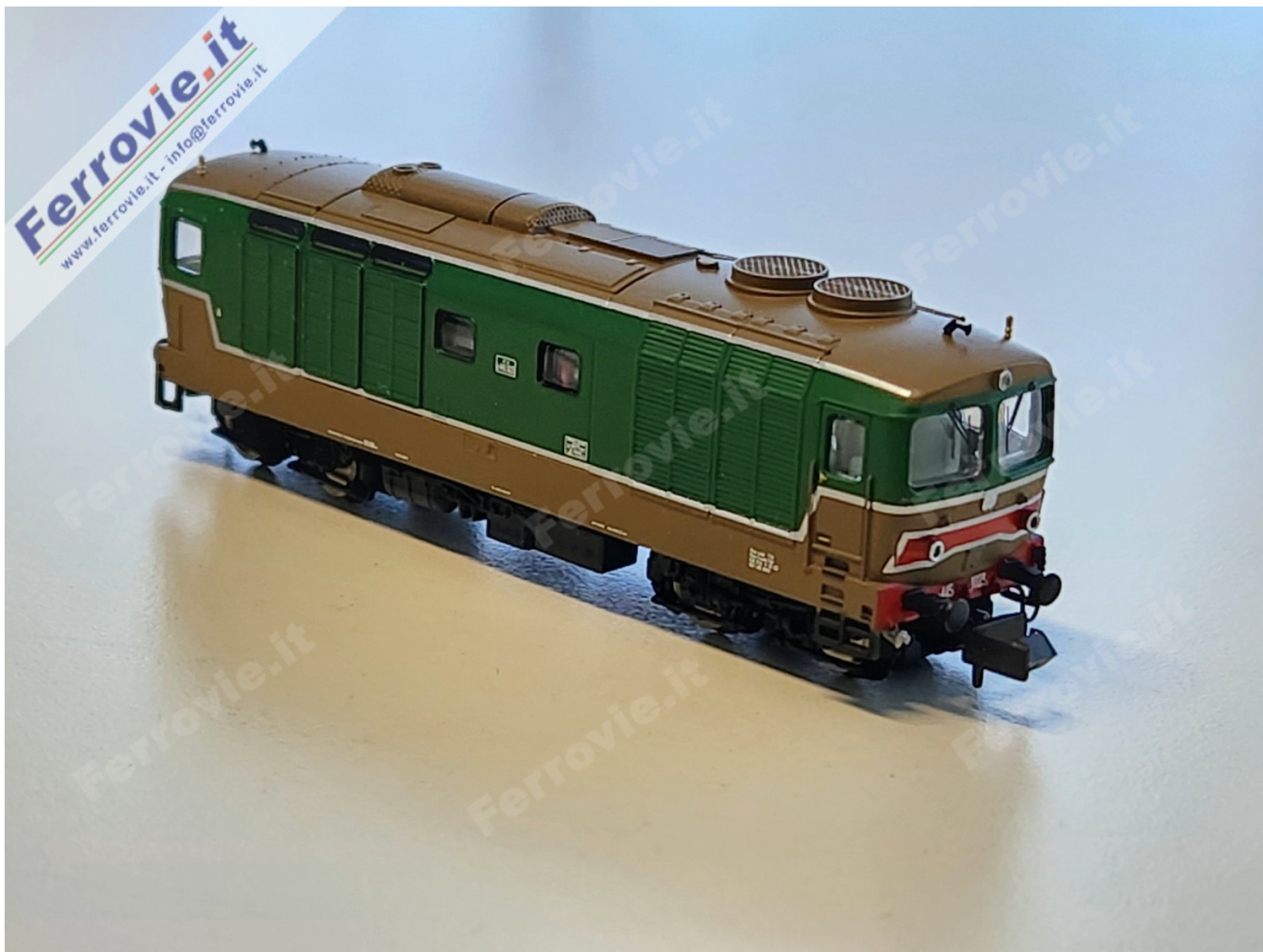
D.445 Arnold. Campione non definitivo.

Guardando tra le sole produzioni modellistiche industriali in scala N di materiale rimorchiato italiano idoneo alle D.445, troviamo carrozze UIC-X di diversi tipi e serie, carrozze letti MU, carrozze Gran Confort e TEE, Z1 e Eurofima oltre a carri merci di ogni tipo. E c'è da scommettere che questa novità possa essere da volano per la produzione di ulteriore materiale rotabile rimorchiato.