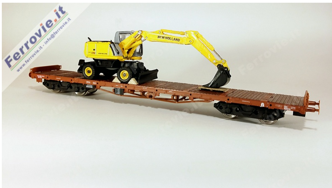
1.1 Pirata - PIV3300 - Carro Rs con carico