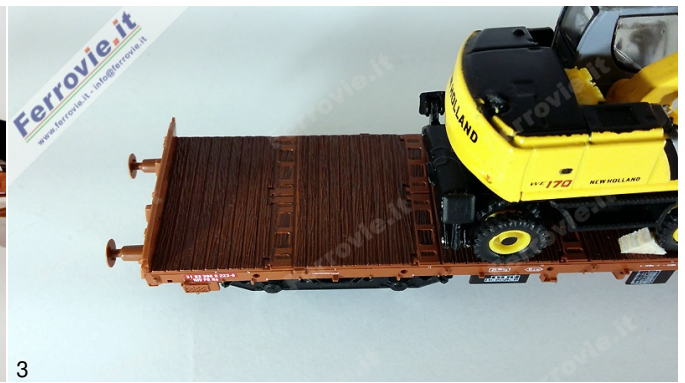
2/3. Pirata - PIV3300 - Carro Rs con carico