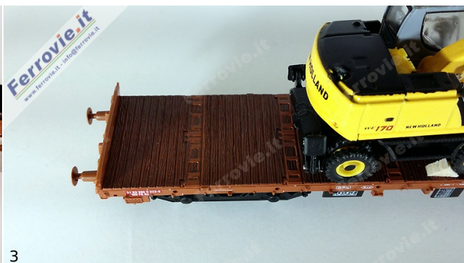
2/3. Pirata - PIV3300 - Carro Rs con carico