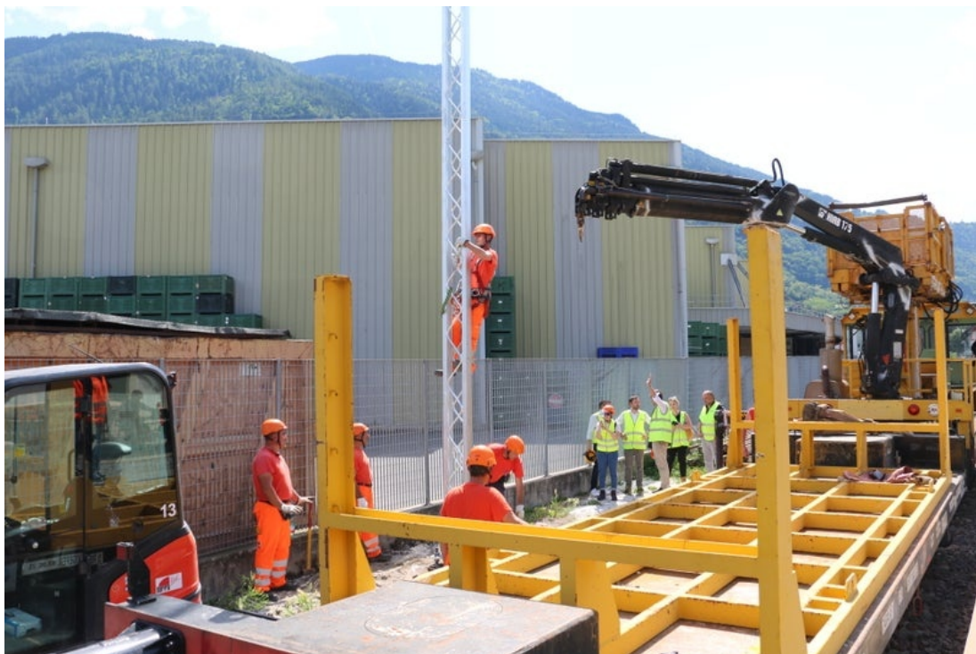
22 Procedono i lavori di elettrificazione della linea ferroviaria della Val Venosta.