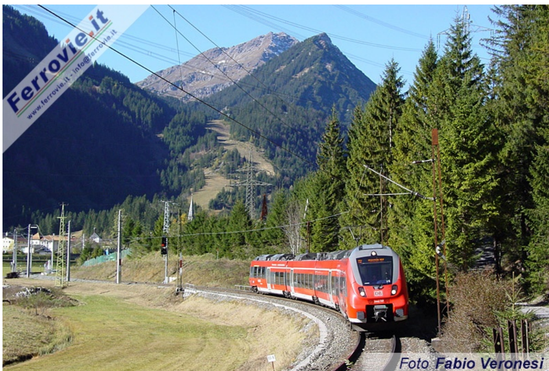
L'Äußerfernbahn collega Kempten e Reutte con Garmisch, attraversando due volte il confine tra Austria e Germania. E' una linea ferroviaria di carattere prevalentemente locale, con un andamento piuttosto tormentato e di conseguenza basse velocità. Il servizio è svolto con i moderni ET 2442 DB come quello nell'immagine, impegnato col RB 5513 Reutte in Tirol - München Hbf, qui ripreso poco oltre la stazione di Bichlbach-Berwang. (Foto Fabio Veronesi, 26 ottobre 2019)