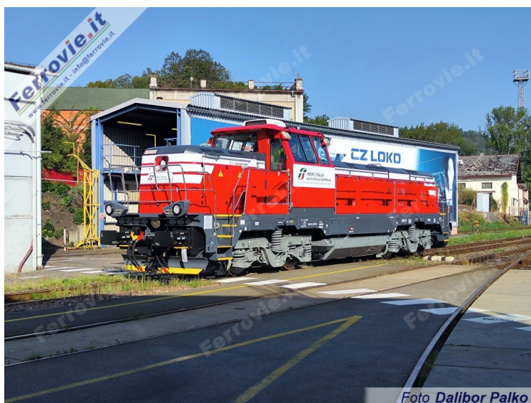
1. La 744.001 al termine della revisione straordinaria, pronta per far ritorno in Italia.

Dopo circa 9 mesi la locomotiva è così rientrata in Italia attraverso il valico di Tarvisio, dove è stata presa in carico da una E.652 di Mercitalia Rail.