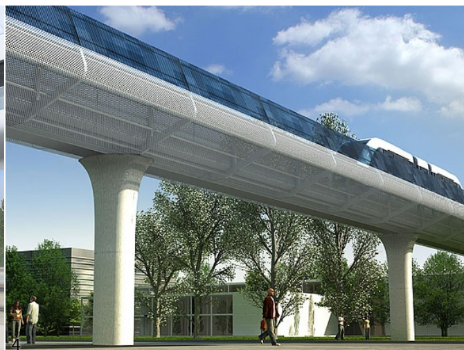
3. Passerella pedonale di collegamento dall'aerostazione alla stazione del People Mover. 4. Rappresentazione di un tratto di linea in sopraelevazione.

Il tempo di percorrenza sarà di 7 minuti e 20 secondi e consentirà di trasportare fino a 400 passeggeri l'ora per direzione, con 2 convogli in servizio; per aumentare l'offerta è previsto in seguito l'acquisto di un terzo convoglio, che consentirebbe alla struttura di trasportare 560 passeggeri/ora.