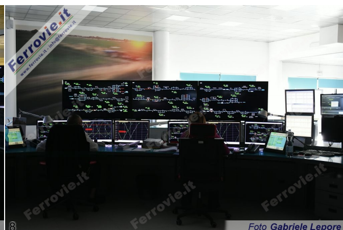
7/8. 26 novembre 2024