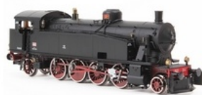
RITORNANO A GRANDE RICHIESTA... Le quattro numerazioni di Gr. 940 ***quantità limitata***