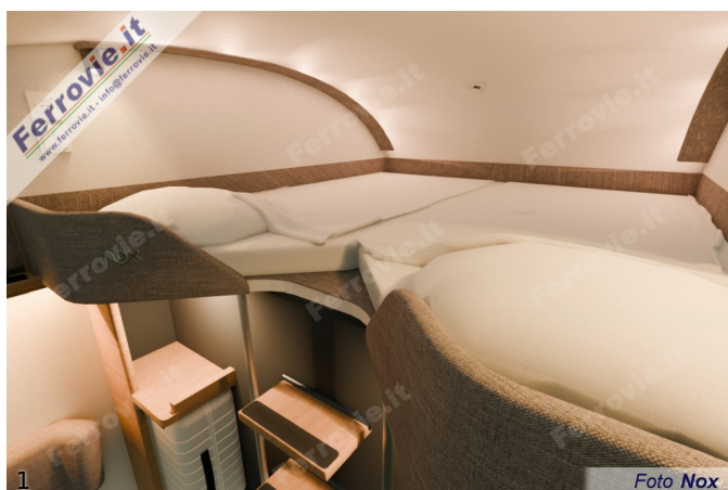
1. Cabina doppia tipo Loft

Secondo una simulazione sulla tratta Lecce-Milano, la tariffa per persona risulterebbe di 179,00 euro sia in cabina doppia Loft che in cabina doppia con vista panoramica, mentre per la singola Loft il prezzo suggerito sarebbe di 99,00 euro.