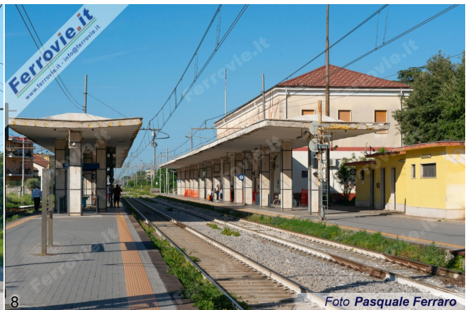
7. Un TAF sosta nella stazione di Acerra, prima di ripartire alla volta di Caserta. (Foto Pasquale Ferraro, 30 maggio 2026) 8. Il fabbricato viaggiatori di Acerra nel penultimo giorno di apertura al pubblico per il servizio commerciale. (Foto Pasquale Ferraro, 30 maggio 2026)