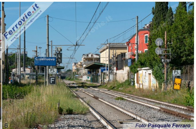
5/6. La stazione di Casalsuovato a meno di 24 ore dalla chiusura della linea storica Napoli - Cancellò. (Foto Pasquale Ferraro, 30 maggio 2026)