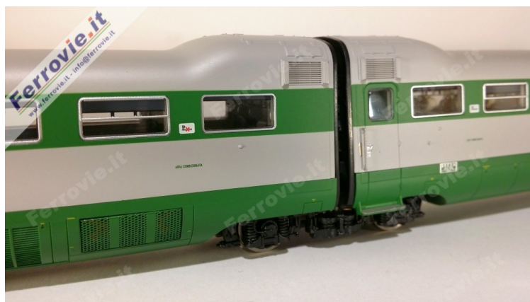
10/11. LE Models 15230 - ETR.231 'Stone' - FS