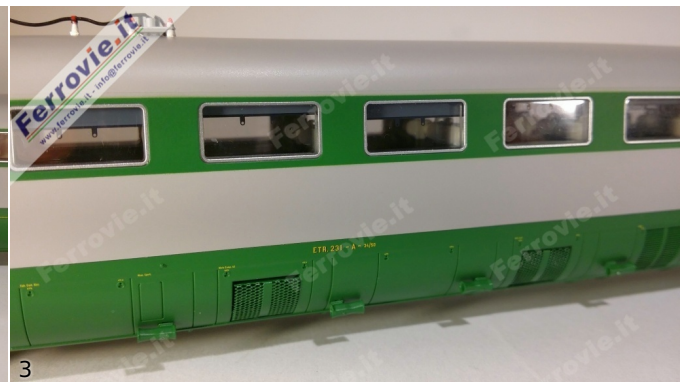
2/3. LE Models 15230 - ETR.231 'Stone' - FS