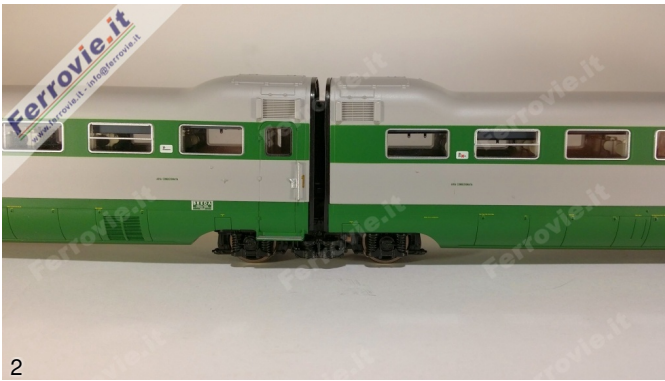
2/3. LE Models 15230 - ETR.231 'Stone' - FS