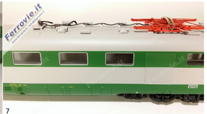
6/7. LE Models 15230 - ETR.231 'Stone' - FS