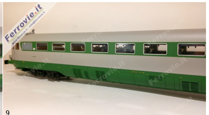
8/9. LE Models 15230 - ETR.231 'Stone' - FS