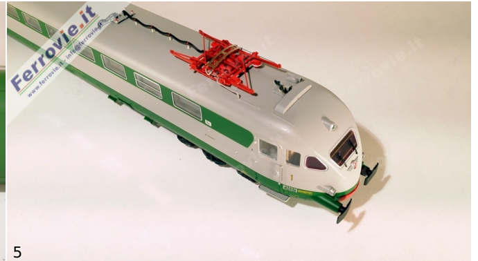
4/5. LE Models 15230 - ETR.231 'Stone' - FS