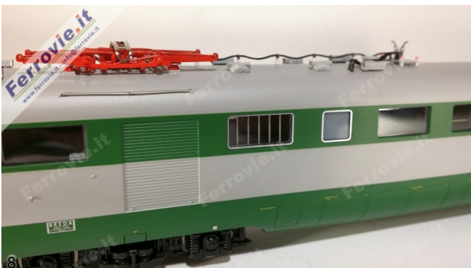
8/9. LE Models 15230 - ETR.231 'Stone' - FS