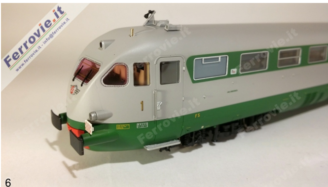
6/7. LE Models 15230 - ETR.231 'Stone' - FS