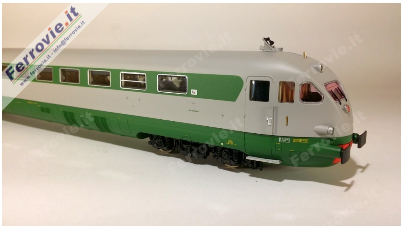
1.1 LE Models 15230 - ETR.231 'Stone' - FS