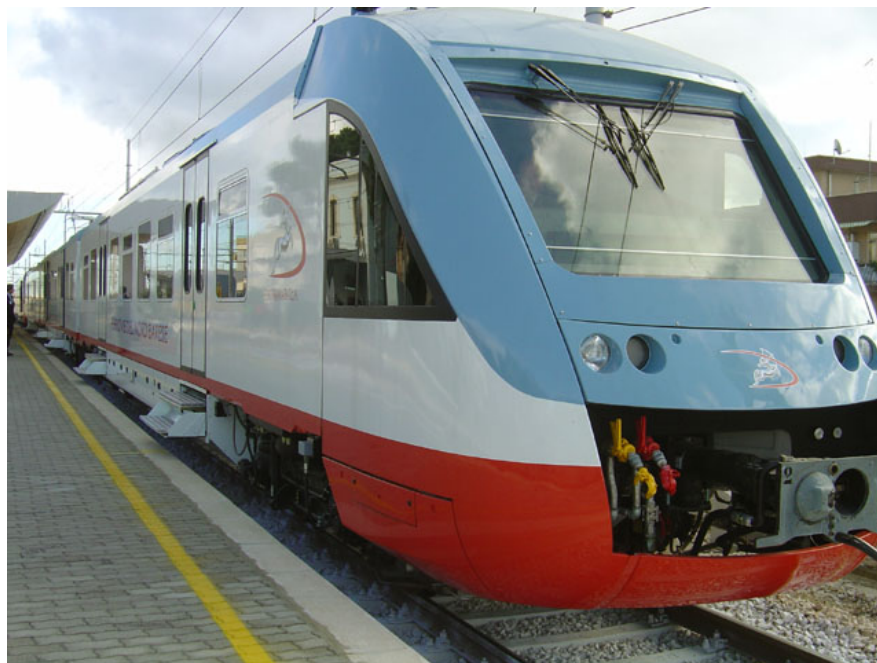
1. Il nuovo elettrotreno Alstom a Terlizzi, in occasione del viaggio inaugurale. (Foto Alstom, 17 novembre 2004)

La Ferrotramviaria - Ferrovia Bari Nord rinnova il parco rotabili. Sono sei i nuovi elettrotreni forniti da ALSTOM, concepiti appositamente per il trasporto ferroviario regionale e che presto diverranno una presenza abituale tra Bari e Barletta e sulla costruenda diramazione metropolitana Bari Lamasinata - San Paolo.