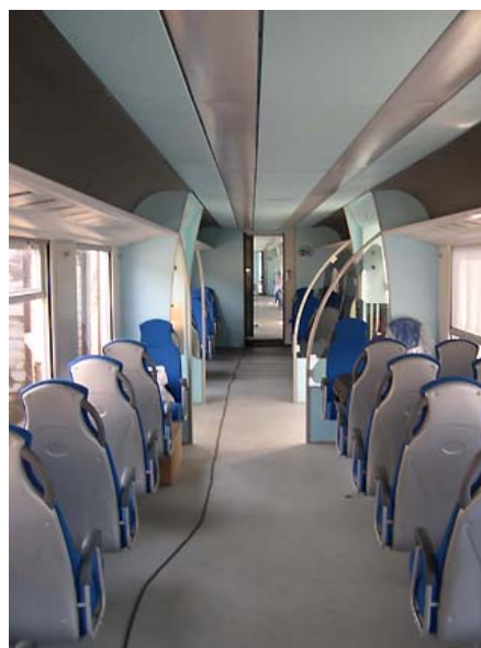
2. Un'altra immagine di uno dei sei treni costruiti da Alstom per Ferrotramviaria, qui in deposito a Bari.