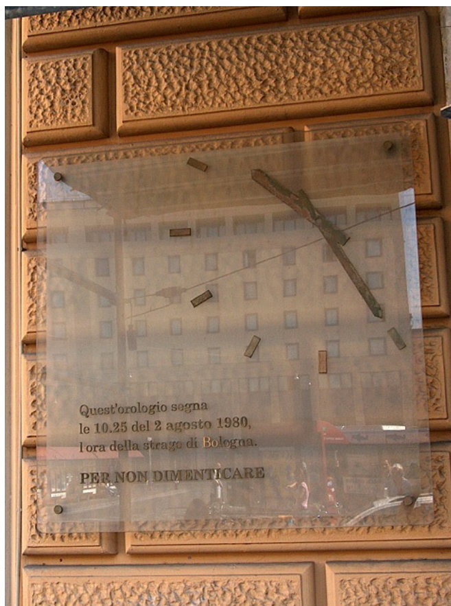
22 Particolare della lapide che riproduce un orologio fermo alle 10.25, orario dell'esplosione della bomba. (Foto Jacopo Fioravanti, 20 luglio 2005)