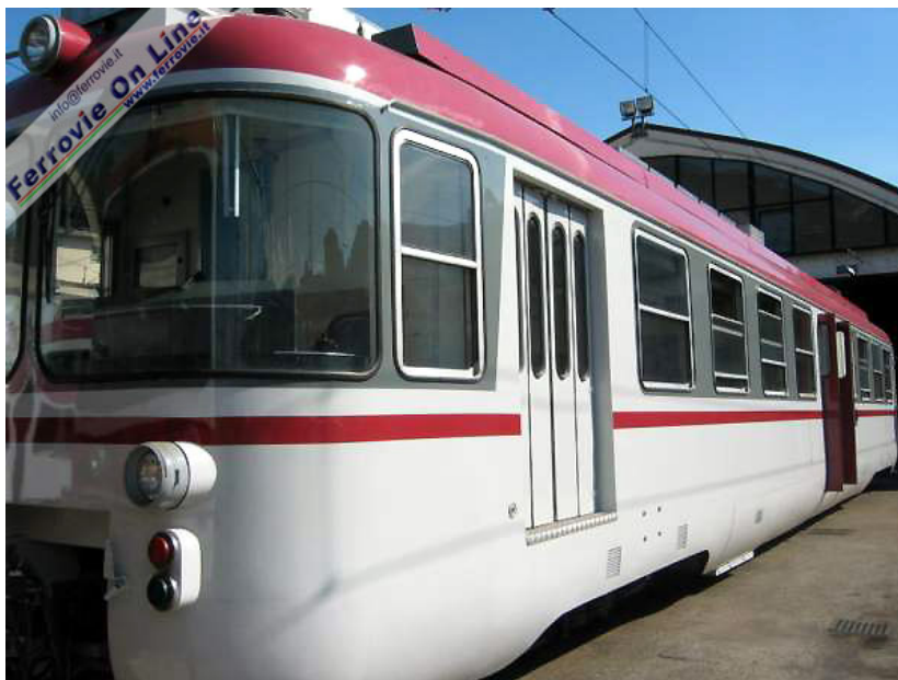
1. L'elettromotrice attrezzata per il trasporto delle bici al seguito. (Foto Provincia Autonoma di Trento, agosto 2005)

TRENTO - E' attivo in via sperimentale dal 19 Agosto al 31 Dicembre 2005 il nuovo servizio di trasporto bici al seguito sulla tratta Trento - Malé. Trentino Trasporti S.p.A., società che gestisce la linea ferroviaria Trento - Marilleva, ha appositamente attrezzato un'elettromotrice in modo da permettere il trasporto di una trentina di biciclette.