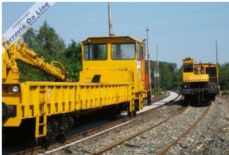
33 Lavori di ripristino della "Linea dei Bivi" nei pressi di Bivio Marocco.