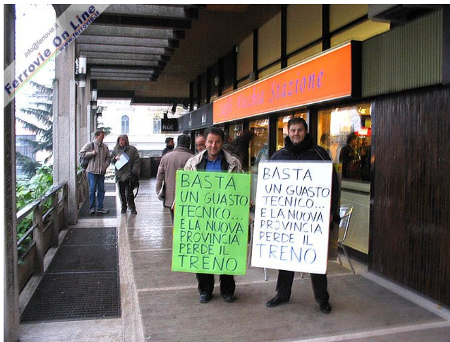
4. Due sostenitori del progetto per il collegamento ferroviario con Malpensa via Monza, con cartelli di protesta per la mancata effettuazione del treno speciale, il giorno della conferenza stampa. (Foto Guido Catasta, 26 novembre 2005)

Il dibattito sul collegamento ferroviario Milano - Malpensa è ancora aperto e molti sono i sostenitori dell'altra alternativa in gioco, che vedrebbe i treni, sempre partendo dalla Centrale, immettersi sulla linea FNME poco prima della stazione di Bovisa, transitando per quella RFI di Porta Garibaldi e percorrendo un nuovo collegamento ancora da realizzare. Questa seconda possibilità terrebbe però nettamente fuori dal servizio l'utenza brianzola e quella bergamasca e del lecchese che potrebbe raggiungere facilmente la stazione di Monza con le linee via Carnate.