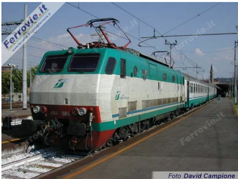
21. La E.444.086 prende in consegna il 708 a Firenze Santa Maria Novella, prima di affrontare l'Appennino verso Bologna. (Foto David Campione, 22 giugno 2003)

Prenotazione obbligatoria anche sugli Intercity?