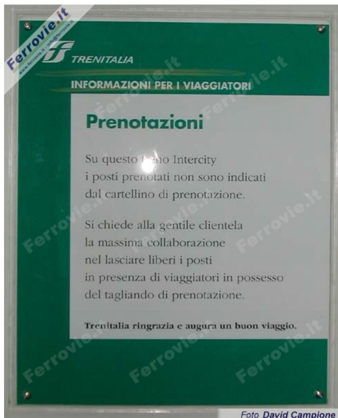
22. L'avviso affisso nei vestiboli delle carrozze di seconda classe dei nuovi Intercity. (Foto David Campione, 22 giugno 2003)

Non saranno più indicati i posti prenotati sulle nuove carrozze per treni Intercity. E' questa una delle novità, passata in secondo piano, delle nuove vetture Z e Gran Confort ristrutturate da Trenitalia, con i primi treni entrati in servizio Tra Udine/Trieste e Napoli. In ogni carrozza è affisso un cartello che invita i passeggeri senza prenotazione a collaborare per lasciare libero il posto a chi è provvisto di prenotazione. La novità sarà estesa anche agli altri Intercity in contemporanea con l'immissione in servizio delle nuove vetture restyling. Sarà l'antipasto della prenotazione obbligatoria anche su i treni IC? (Giancarlo Scolari)