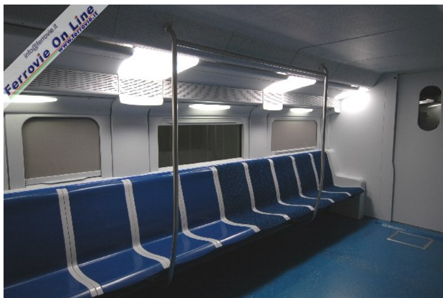
3 3 Interni del TAF numero 30, con le nuove poltrone disposte con le spalle ai finestrini.

Facendo infine tesoro delle esperienze maturate durante questi anni di esercizio, sono state apportate alcune modifiche alle porte, finalizzate a migliorarne e velocizzare il funzionamento, e sono stati introdotti nuovi pulsanti di apertura corredati da segnalazione in braille e di un avviso acustico che ne agevola l'individuazione, soprattutto per i clienti ipovedenti.