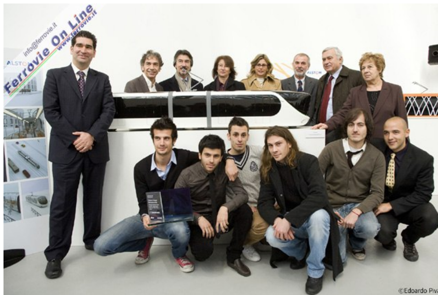
4 Il team dell'Istituto Europeo di Design di Roma, vincitore del concorso con il progetto Open Tram.