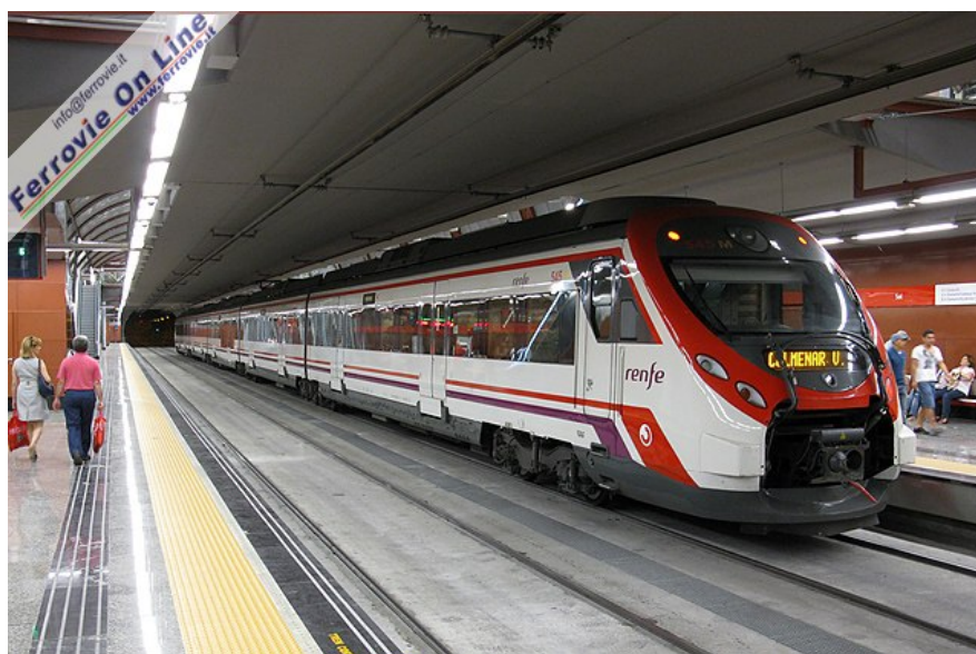
Il piano binari, due livelli sotto il piano stradale. Un moderno elettrotreno Classe 465, in servizio sulla linea C4, è in partenza per Colmenar Viejo. (Foto Jacopo Fioravanti, 04 aprile 2009)