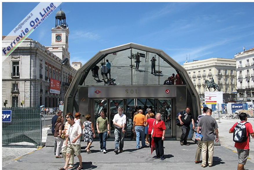
Vista di fronte, la copertura in vetro e metallo dell'ingresso alla stazione si inserisce forse meglio nel contesto di Puerta del Sol.

così essere raggiunto da Sol, per ferrovia, in appena 20 minuti.