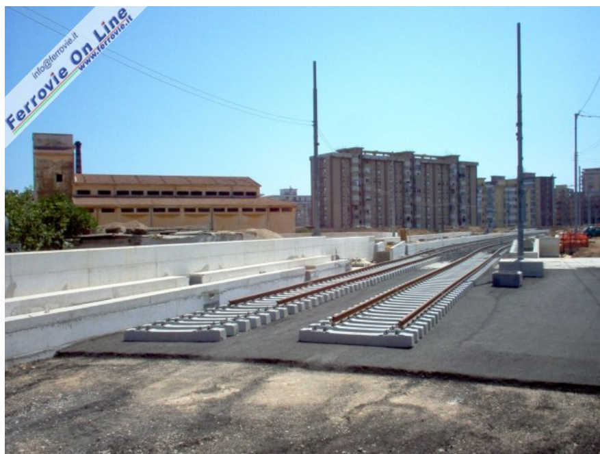
2. Il nuovo sovrappasso su via Brancaccio proveniente da Guadagna verso Brancaccio. (Foto Paolo Simon, 4 luglio 2009)