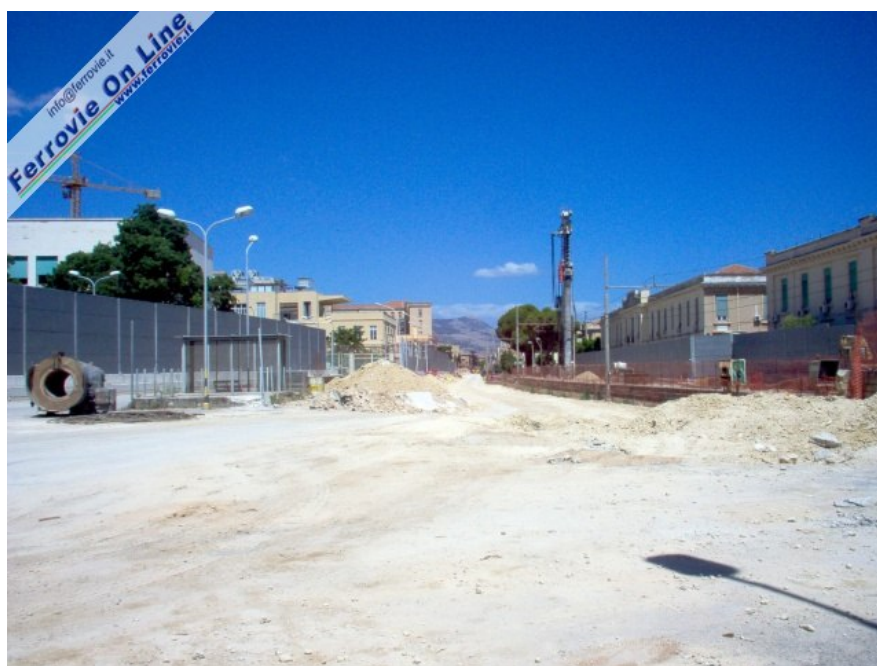
3. Via Vespri in direzione di Orleans. La linea attualmente in esercizio a binario unico attraversa la zona ospedaliera di Palermo, tagliandola in due. Si nota a destra la trivella per la realizzazione dei pali di fondazione della trincea accanto alla linea attualmente in esercizio. (Foto Paolo Simon, 19 luglio 2009)

Dopo la fermata Orleans proseguendo in direzione Vespri - Guadagna la linea oggi risale in superficie per attraversare con un passaggio a livello la via Vespri. In questo tratto è previsto l'interramento della linea in trincea coperta. Sopra di essa verrà realizzato in prolungamento della via Lodato fino alla via Vespri. La linea attualmente in esercizio a binario unico proveniente dalla fermata Orleans attraversa la zona ospedaliera della città, tagliandola in due.