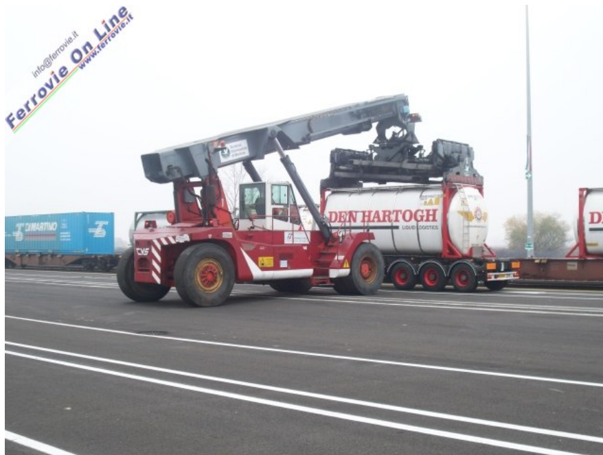
22 Dimostrazione di scarico dei carri all'interno del Polo Logistico di Mortara. (21 novembre 2009)