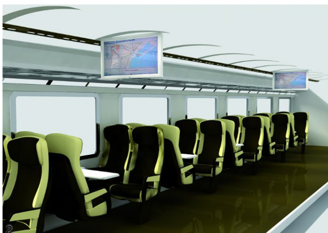
2. Particolare dei sedili con i monitor informativi di bordo. (Disegno Arenaways)

Complessivamente, gli addetti occupati saranno circa 50. Innovativa la concezione dei convogli: Arenaways promette pulizia quotidiana, comfort e sicurezza, massima accessibilità alle persone con disabilità. Ogni vettura sarà dotata di schermi LCD e prese di corrente, mentre sui convogli sarà possibile fare shopping presso la 'bottega di bordo'. Ogni treno sarà dotato di una carrozza speciale che ospiterà un desk per informazioni e assistenza e dove sarà possibile l'acquisto dei biglietti senza supplemento. Completano la dotazione di sicurezza un impianto anticendio nelle carrozze e la presenza a bordo di un defibrillatore utilizzabile dal personale in caso di emergenza.