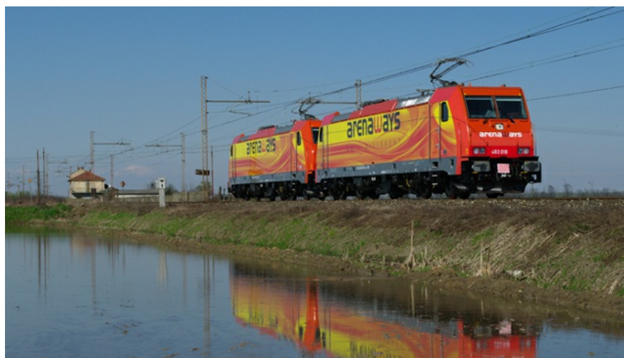
1 Due delle tre locomotive E.483 noleggiate da ArenaWays per i propri servizi.

TORINO - Debutterà a settembre sulla linea Torino-Milano il primo concorrente di Trenitalia nel trasporto passeggeri nazionale. Si tratta di Arenaways, operatore di Alessandria. L'annuncio è stato dato il 15 luglio a Torino durante una conferenza stampa presso la Mole Antonelliana. Arenaways opererà verso la Lombardia con due treni e 5 coppie giornaliere tra i due capoluoghi che toccheranno le stazioni di Torino Lingotto e Porta Susa, Santhià, Vercelli, Novara, Rho Fiera e Porta Garibaldi. Saranno inoltre attivate quattro corse giornaliere da Arquata Scrivia verso Milano e Torino. In un secondo momento verrà completato l'anello virtuale tra Torino e Milano con le fermate intermedie di Pavia, Alessandria e Asti.